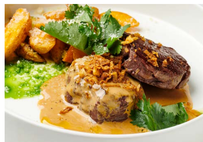
Медальоны с перечным соусом и картофелем айдахо 280 г | 1000 ₽