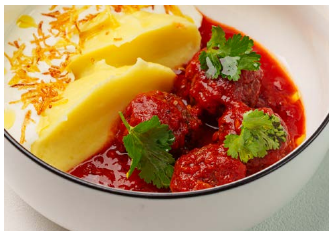
Митболы в томатном соусе с картофельным пюре и муссом из пармезана 280 г | 450 ₽