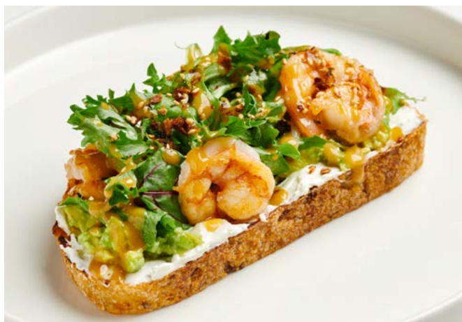
Креветки с гуакамолем и горчичным соусом