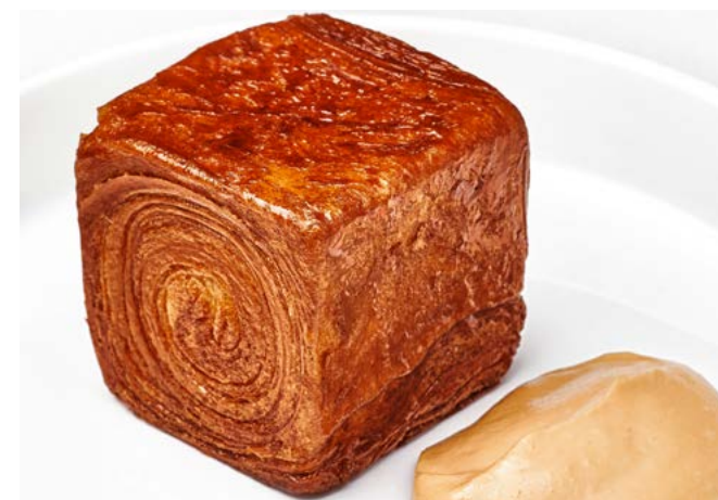
Круассан Пикассо с шоколадом 120 г | 430 ₺