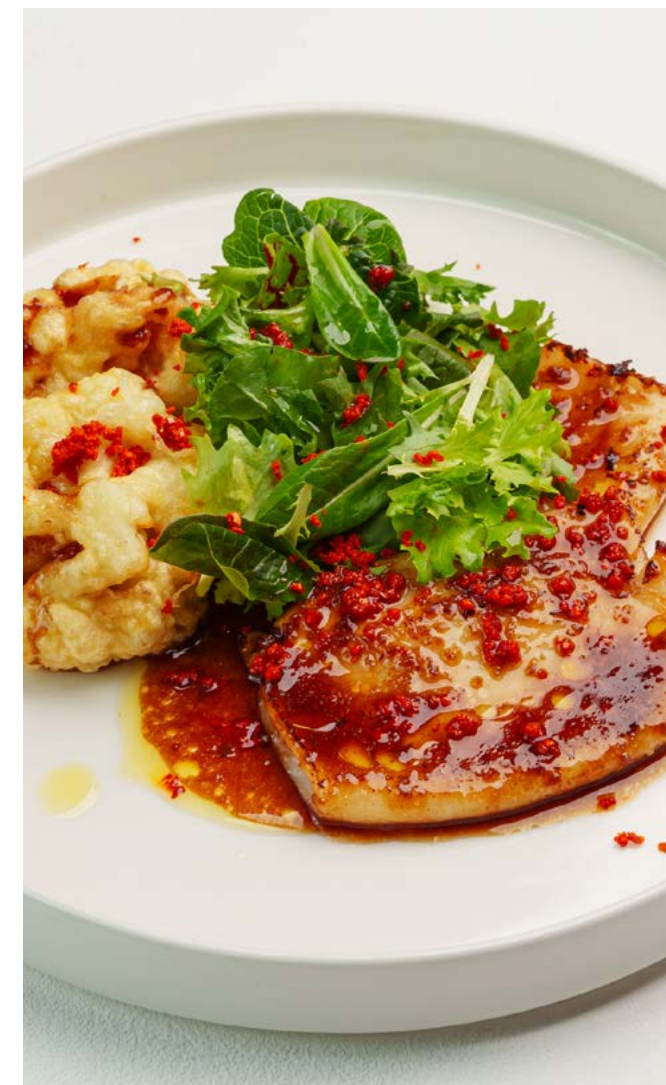
Кальмары гриль с цветной капустой фри