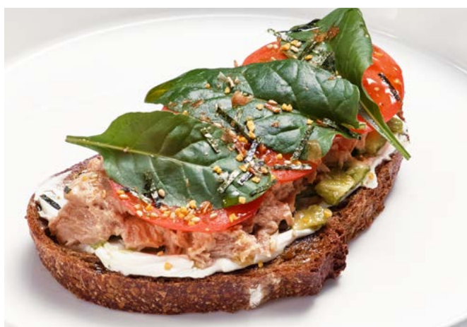
Туец с пайси и крем-чиз