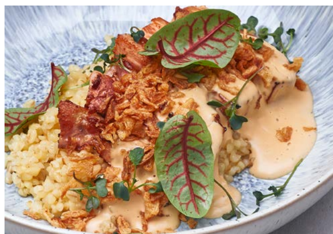
Филе куриного бедра с булгуром