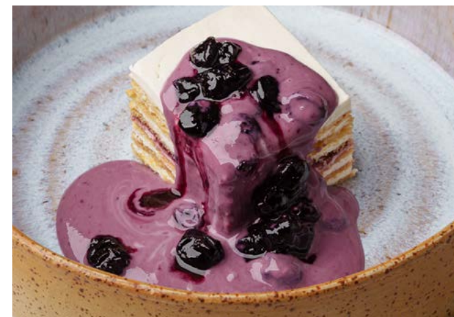
Сметанник с черникой 130 г | 430 ₺