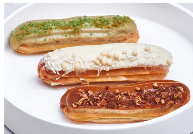
Эклер фисташка / пломбир / солёная карамель 55 г | 260 ₺