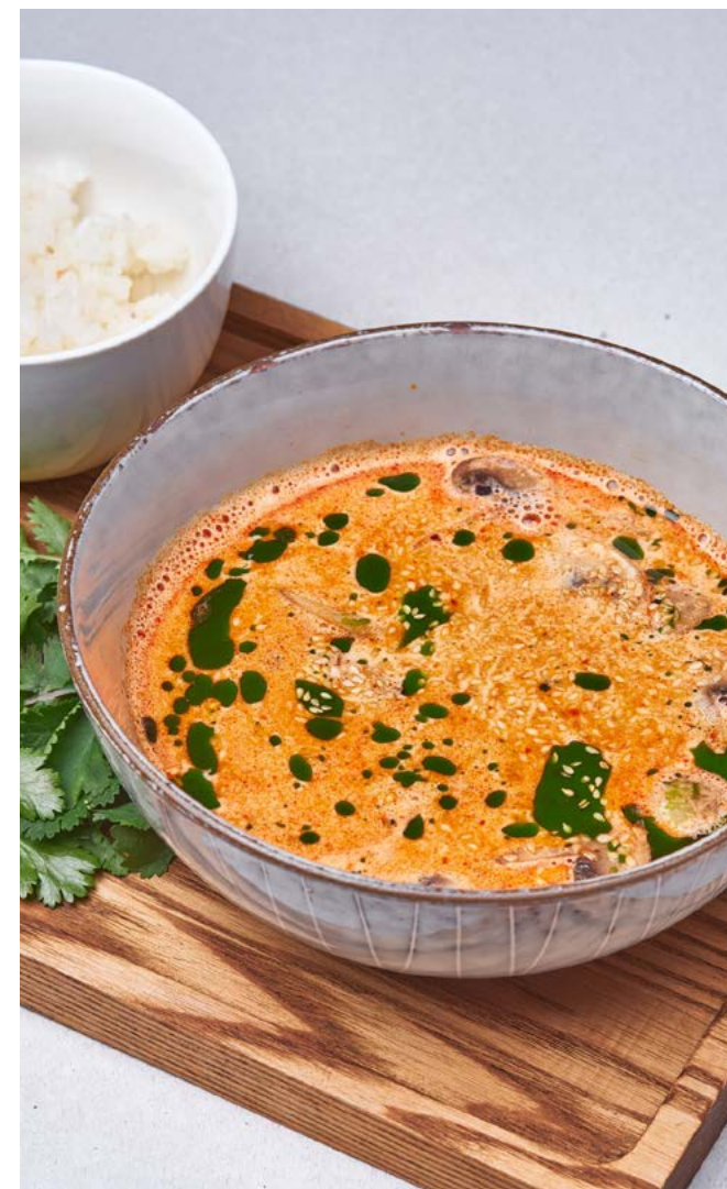
Том ям с креветками и курицей 350/50 г | 560 ₽