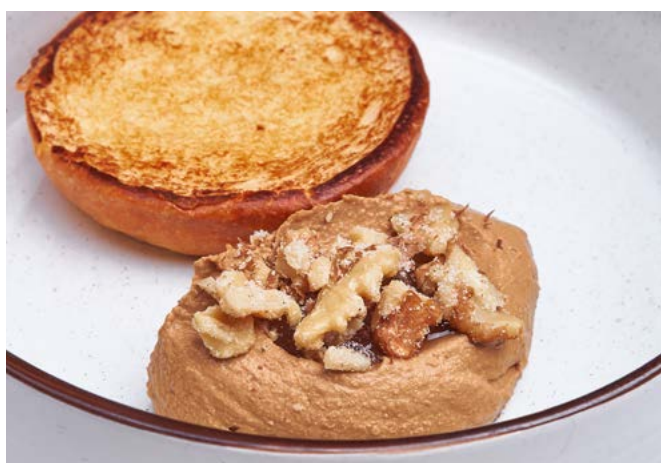
Бришь с пате из куриной печени и джемом