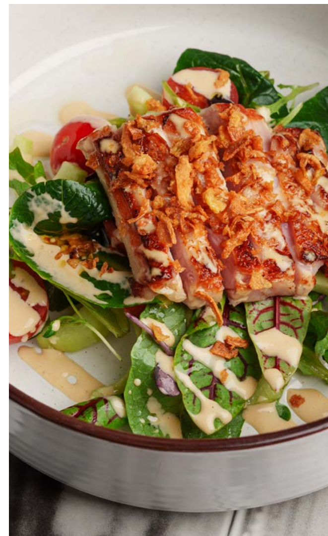
С куриным бедром, овощами и соусом жу