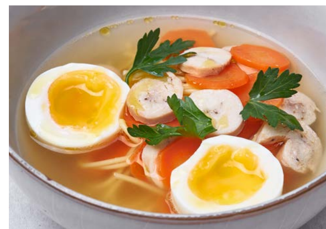
Куриный суп с яичной лапшой 400 г | 350 ₽