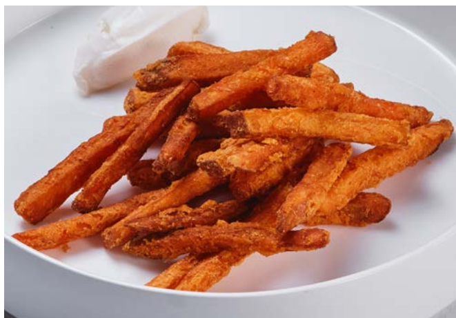
Батат фри с крем-чиз