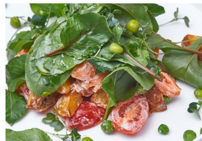
С лососем, томатами черри и картофелем