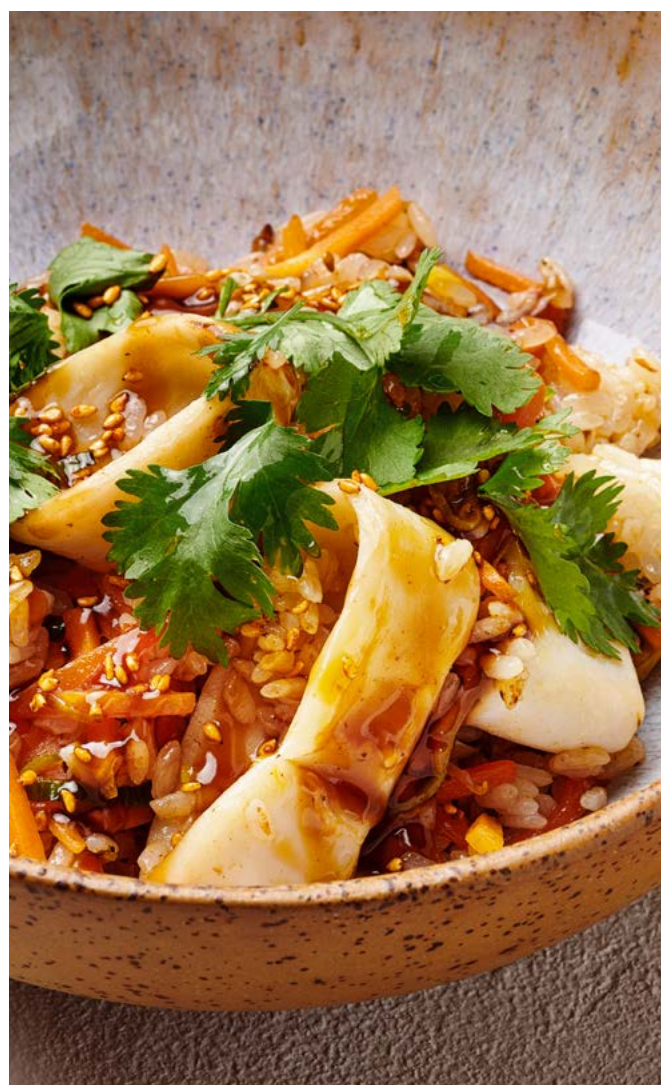
Рис вок с кальмаром