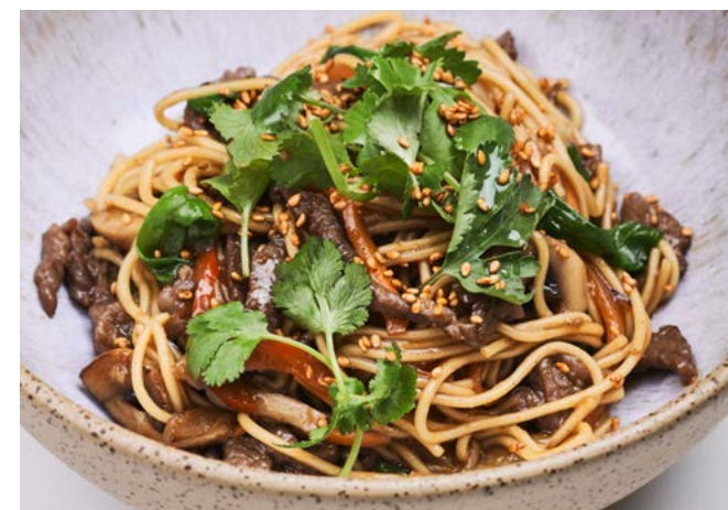
Корейская лапша с говядиной