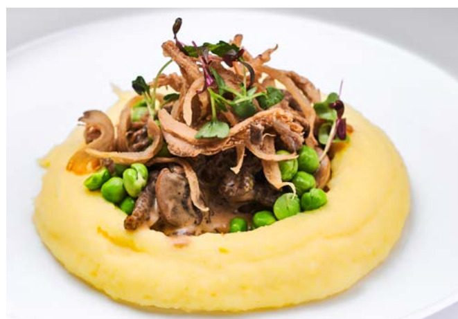
Говядина в перечном соусе с картофельным пюре 230 г | 600 ₽