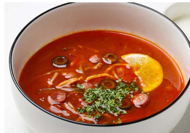
Солянка по-классике 330 г | 450 ₽