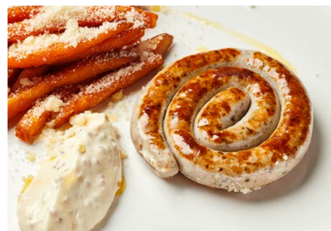
Баварская колбаска с бататом фри и горчичным соусом 200 г | 600 ₽