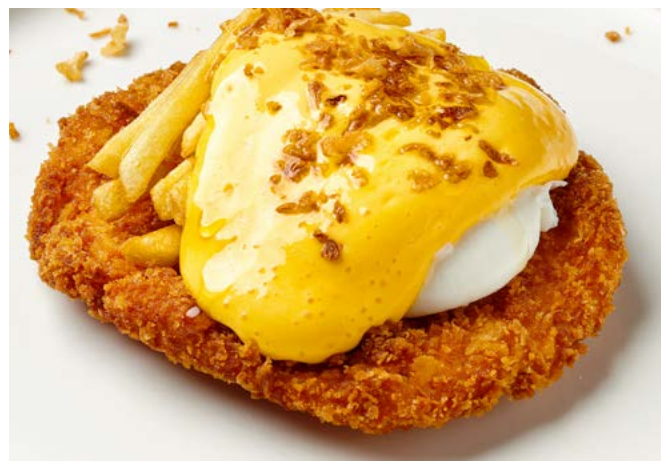
Шницель из курицы с яйцом пашот и сырным соусом