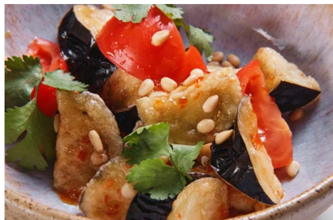
Хрустящие баклажаны с томатами