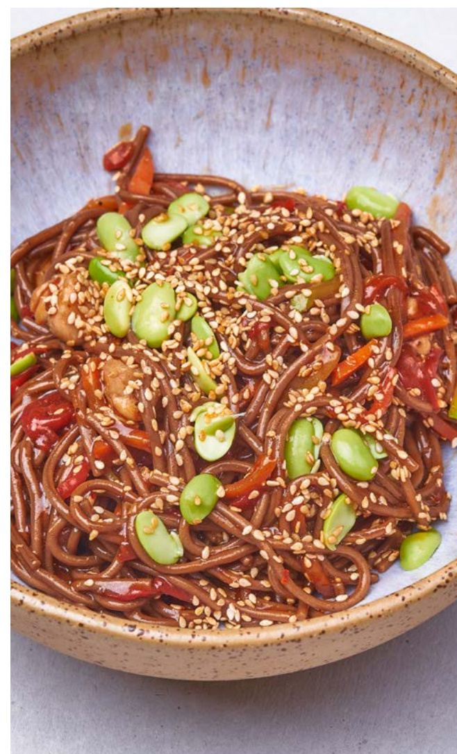
Японская лапша с курицей и овощами