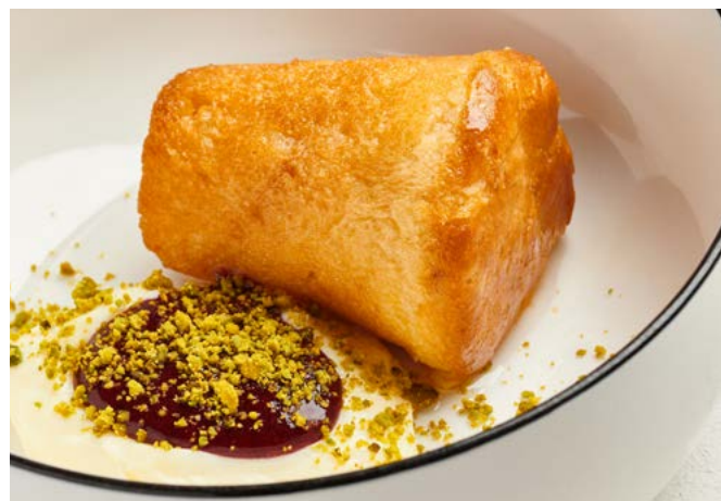
Ромбаба с патисьером и вареньем 140 г | 300 ₺