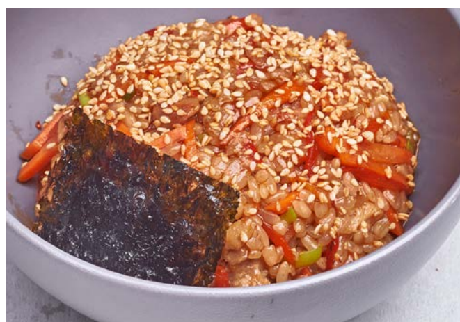
Рис вок с курицей 230 г | 480 ₽