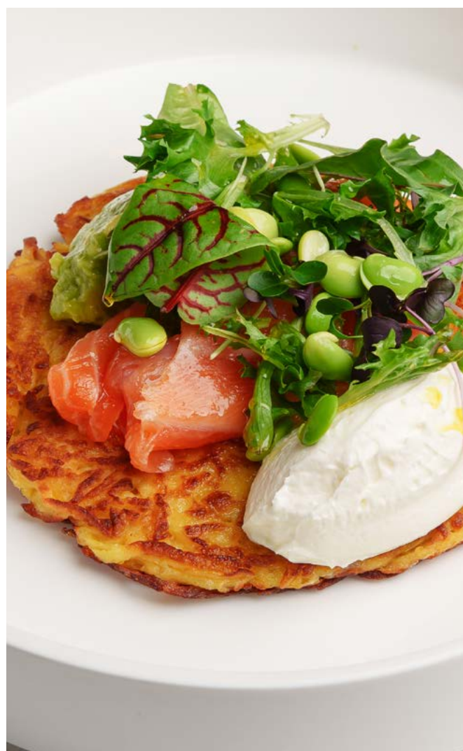
Драник с малосольным лососем и сливочным соусом