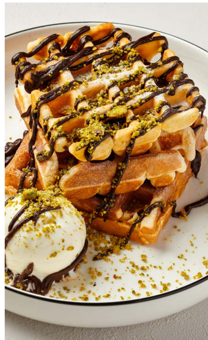
Вафли с шоколадом, фисташкой и сливочным мороженым 200 г | 400 ₺