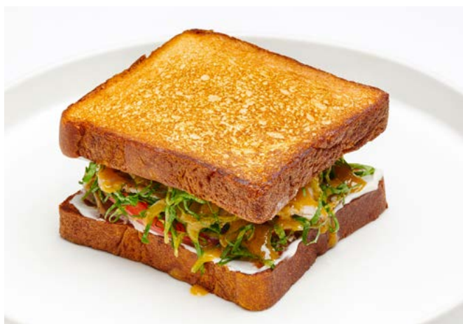
Пастроми из индейки с горчичной заправкой