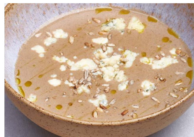
Грибной суп-пюре с дорблю 270 г | 380 ₽