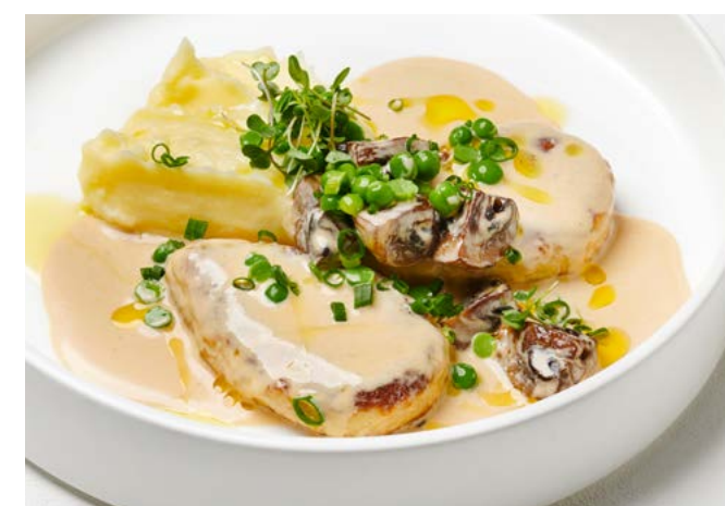
Котлеты из щуки с картофельным пюре и грибным соусом