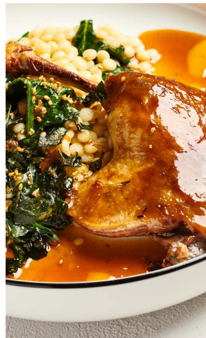
Утиная ножка с птитимом, шпинатом и соусом жу 300 г | 750 ₽