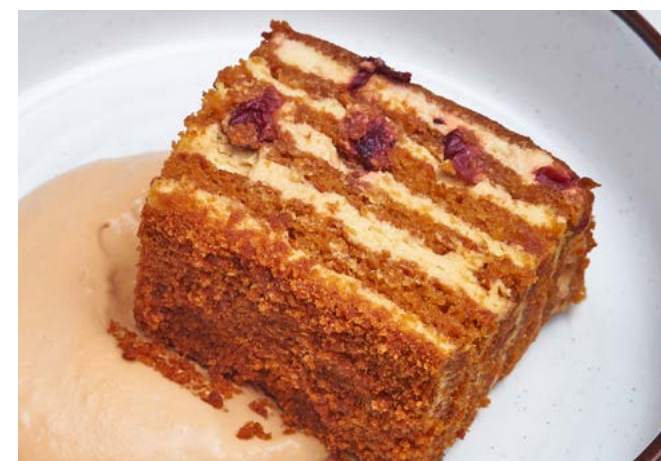
Медовый торт с брусникой 130 г | 350 ₺