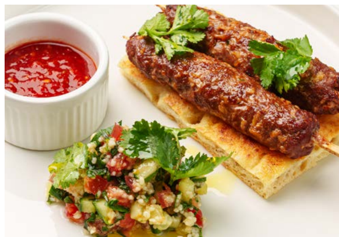
Кебаб из телятины с салатом табуле