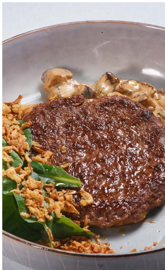
Бифштекс с яйцом пашот и соусом из белых грибов