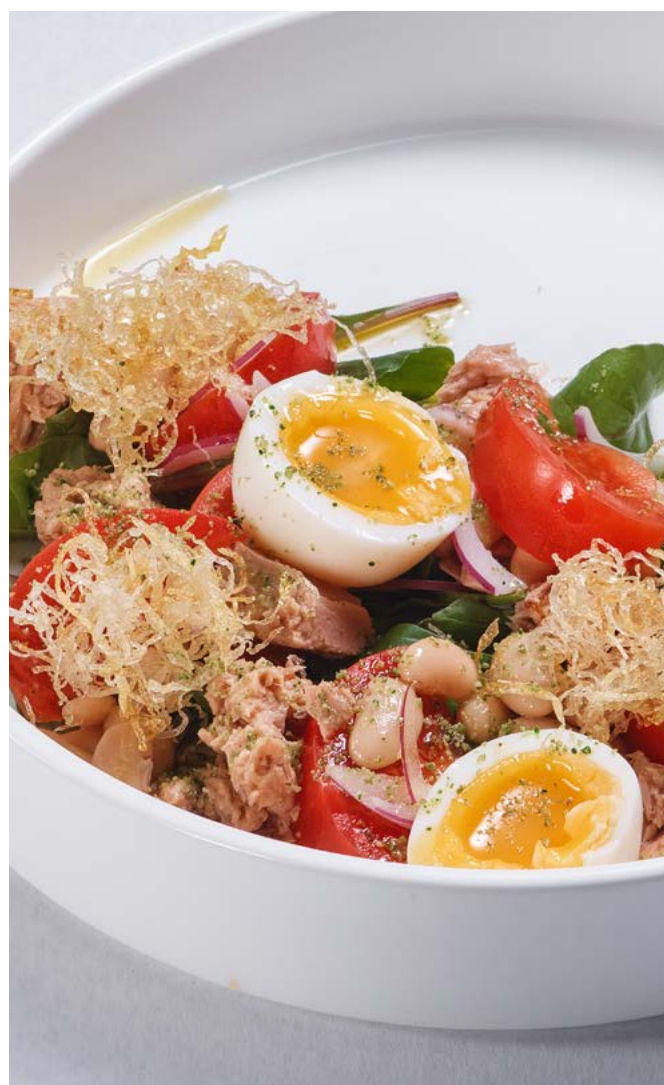
Нисуаз с тунцом 200 г | 440 ₽