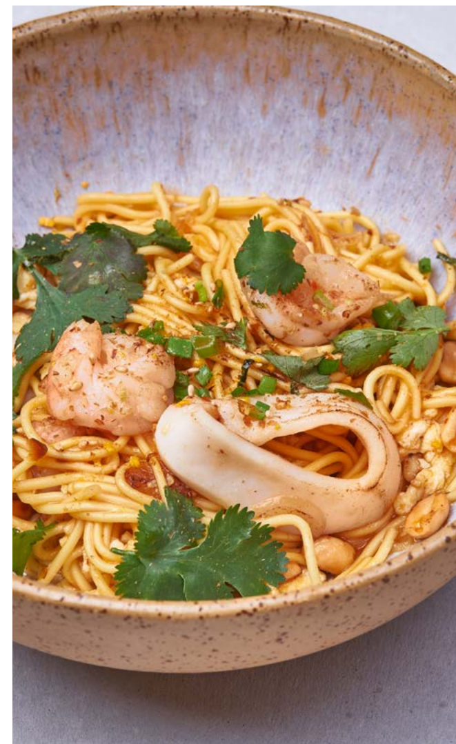
Тайская лапша с кальмарами и креветками