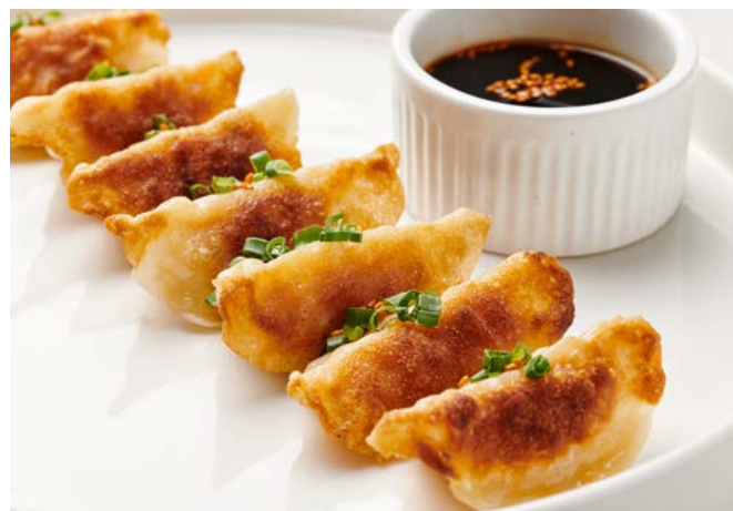
Гёдза с креветкой и соусом понзу