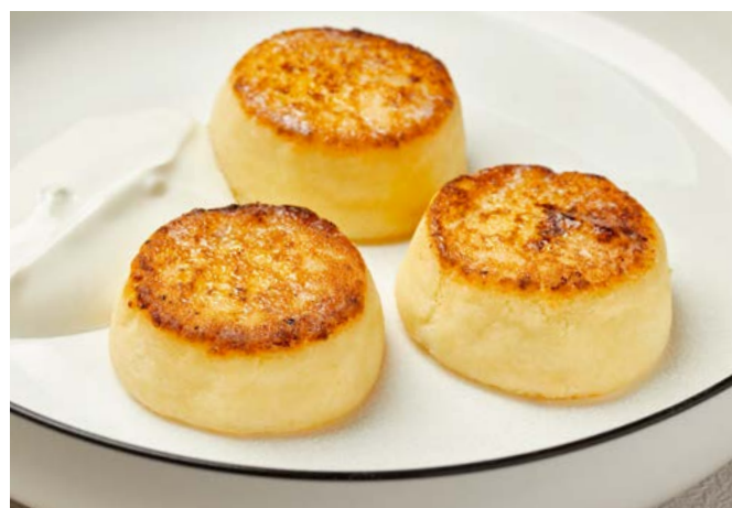
Сырники со сметаной / вареньем 180 г | 400 ₺