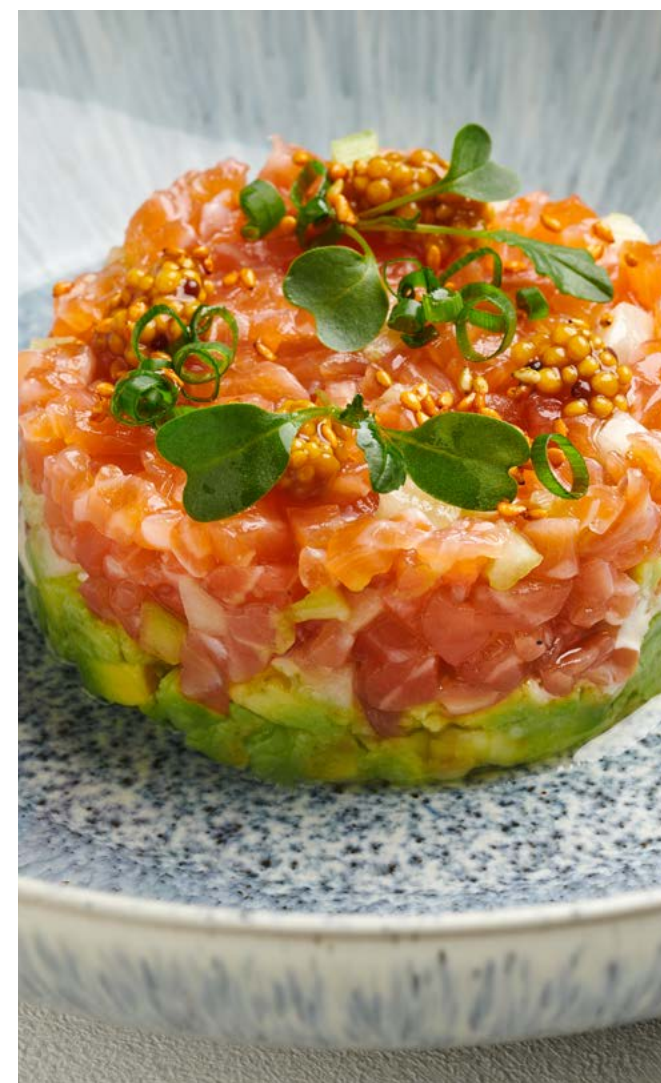
Тартар из лосося с авокадо и злаковым тостом