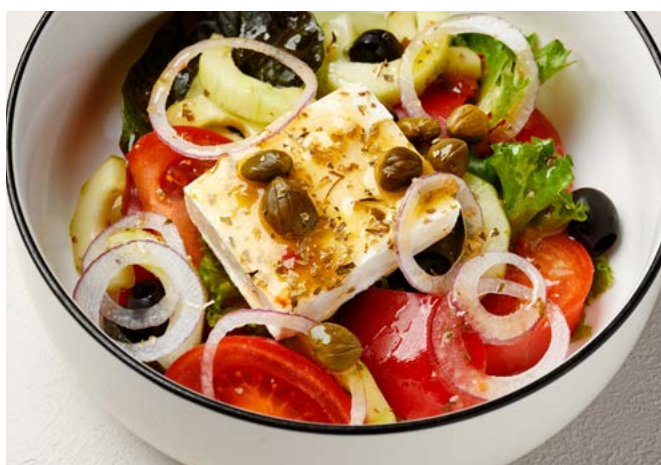
Греческий с фетой 230 г | 480 ₽