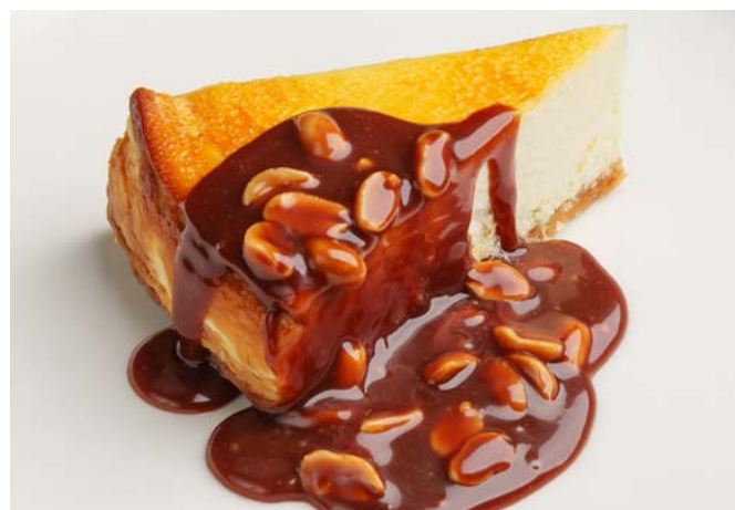
Чизкейк с карамелью и арахисом 150 г | 420 ₺