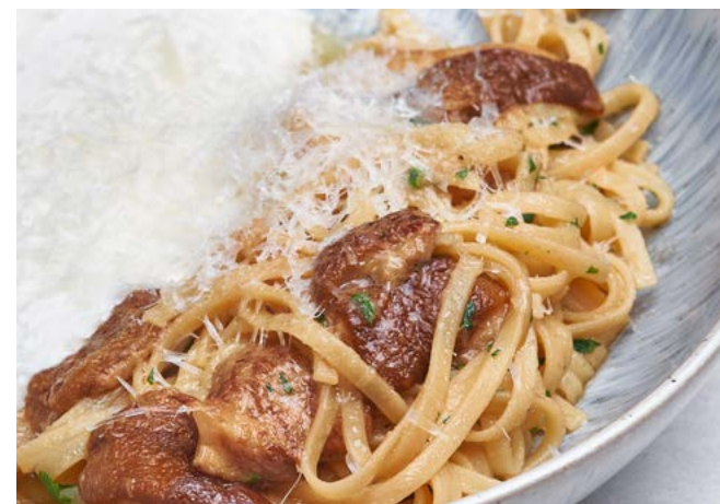
Лингвини с белыми грибами