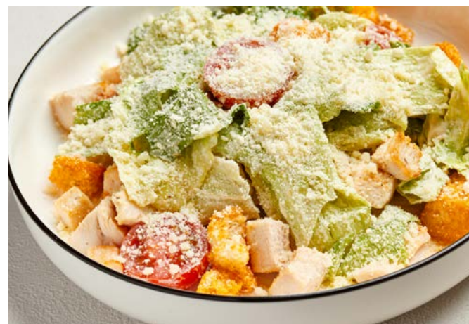
Цезарь с курицей 250 г | 470 ₽