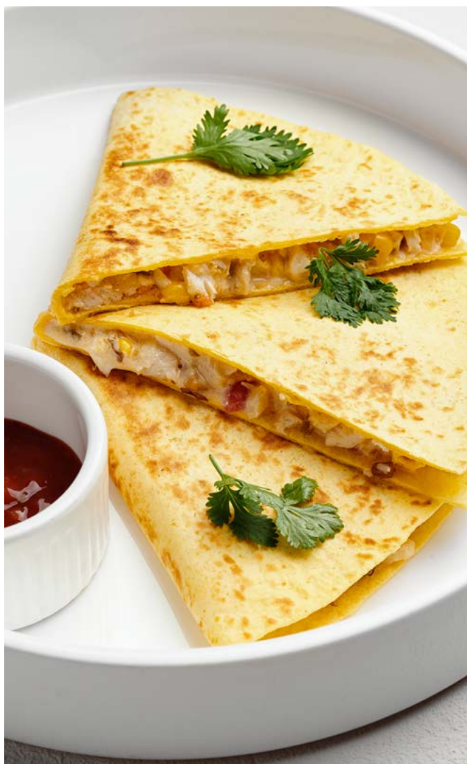
Кесадилья с курицей и соусом сальса