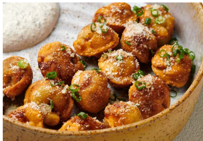
Жареные пельмени с трюфельной сметаной