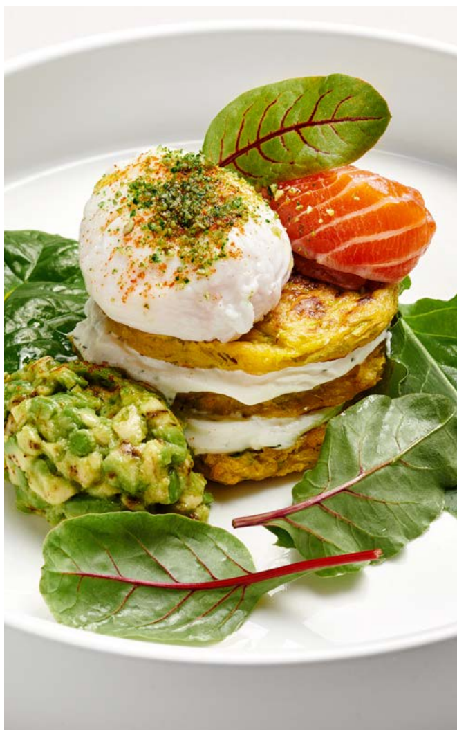
Оладьи из цукини с малосольным лососем и яйцом пашот