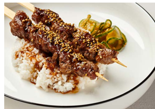
Говядина якитори с кунжутным соусом и огурцом кимчи 180 г | 570 ₽