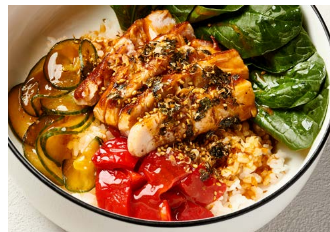
Карри боул с куриным бедром, огурцом кимчи и печёным перцем 300 г | 500 ₽