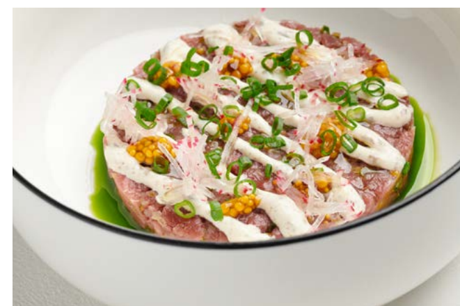
Тартар из говядины с трюфельным айоли