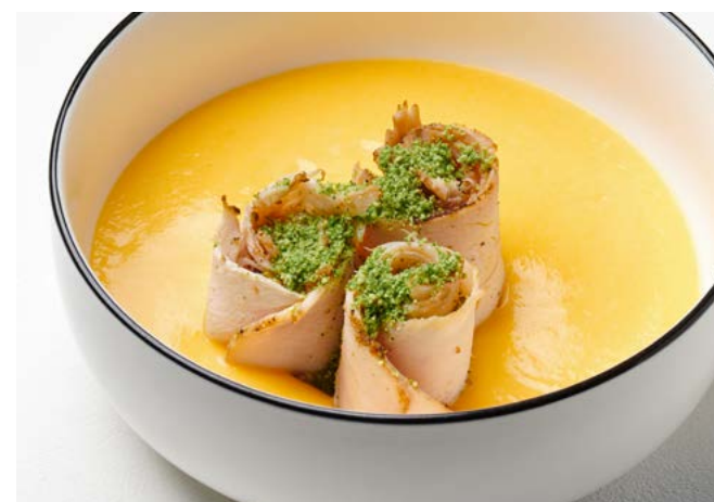
Тыквенный крем-суп с пастроми из индейки 300 г | 420 ₽