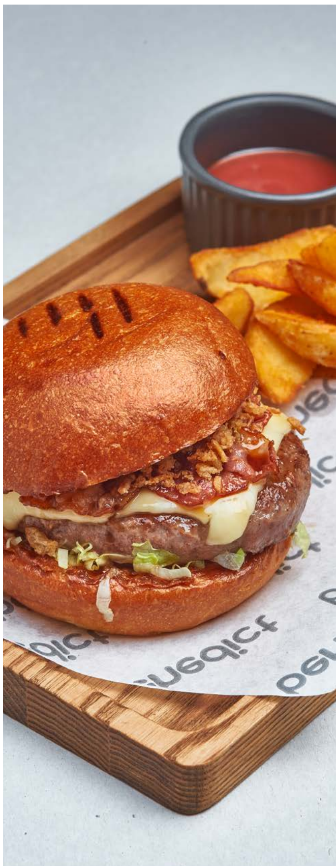
Джек Дэниелс бургер