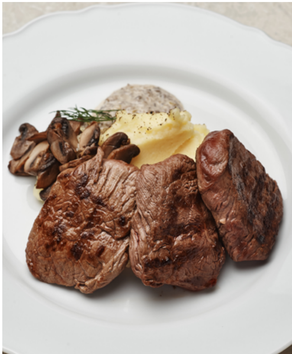
Медальоны из телятины с пюре и грибным соусом