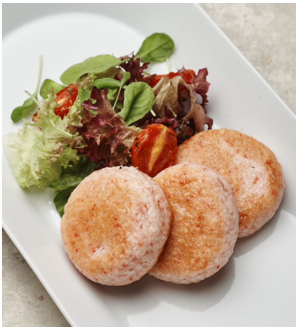
Крабовые котлеты с салатным миксом и соусом руй