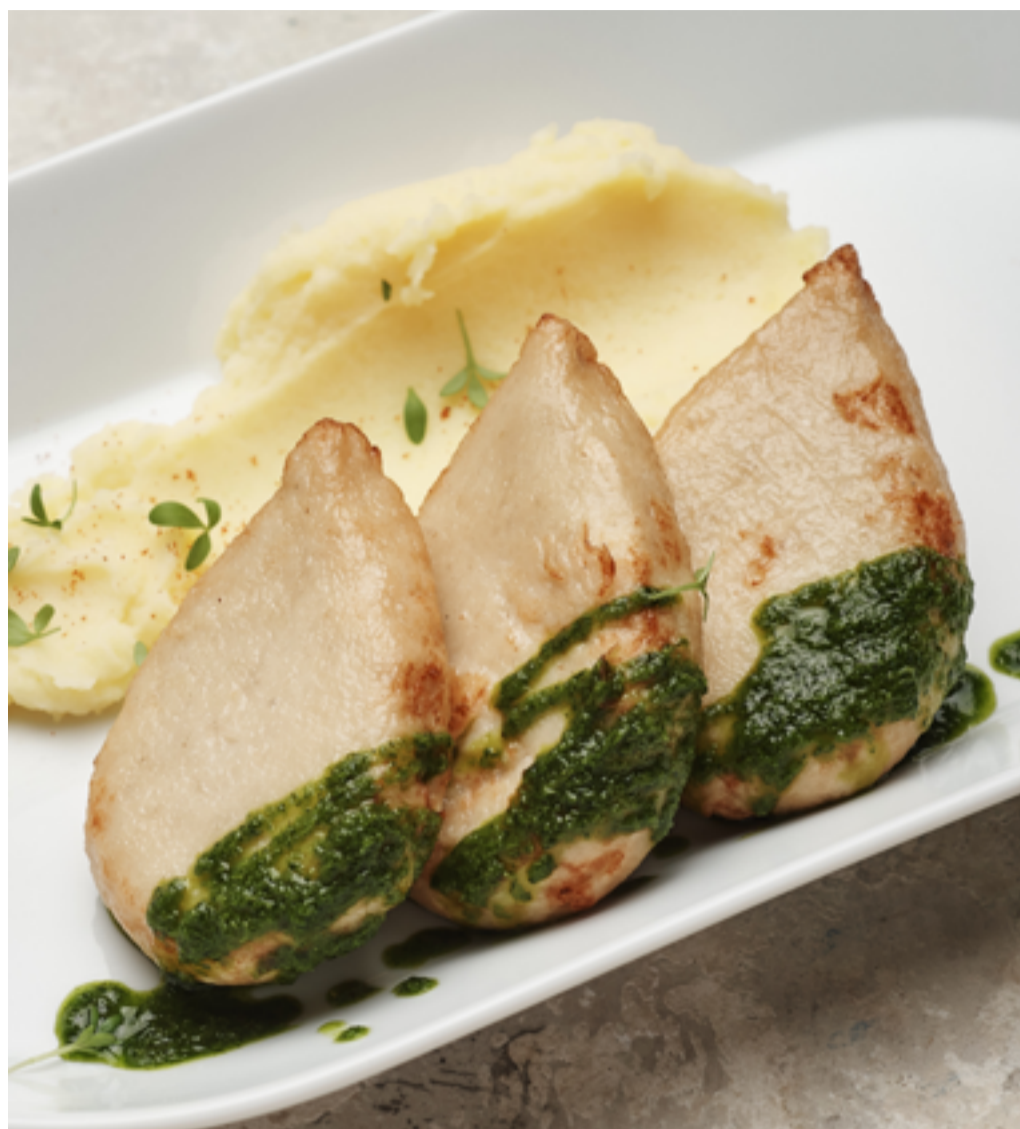
Котлетки из щуки с пюре и сырным соусом