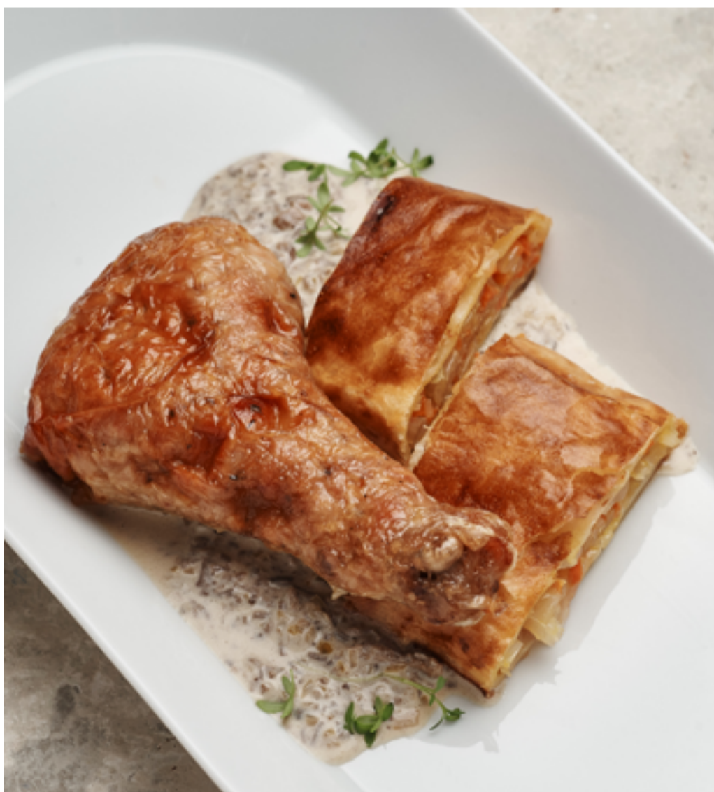
Фаршированная ножка с капустным пирожком и грибным соусом