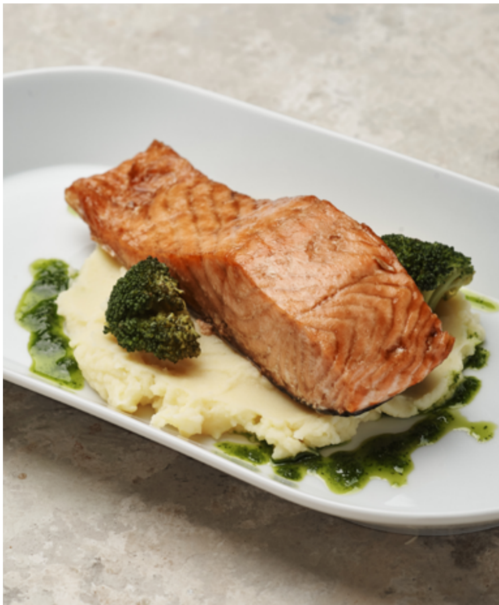
Сёмга гриль со сливочным картофелем и цветной капустой