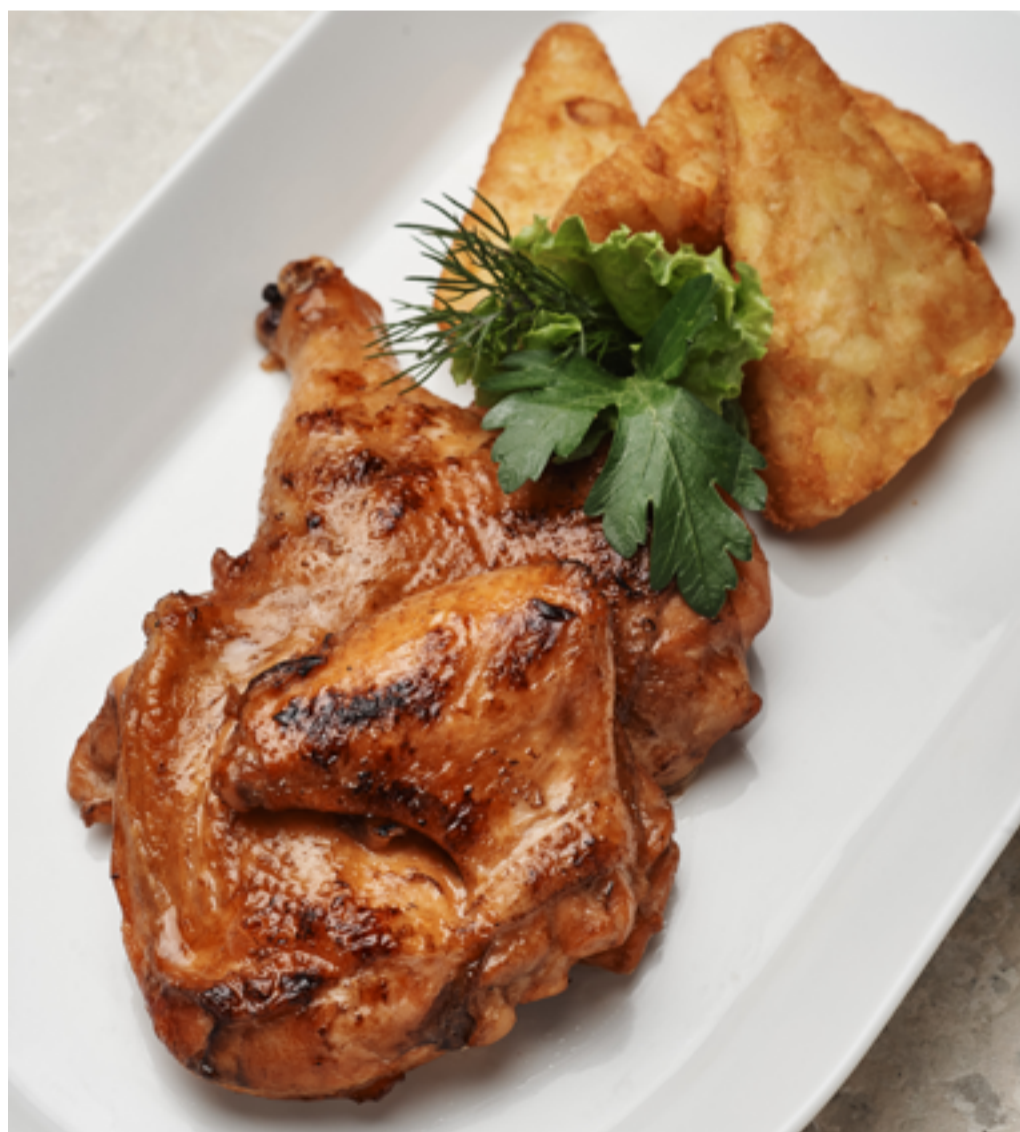
Цыплёнок табака и хашбрауны с соусом цезарь