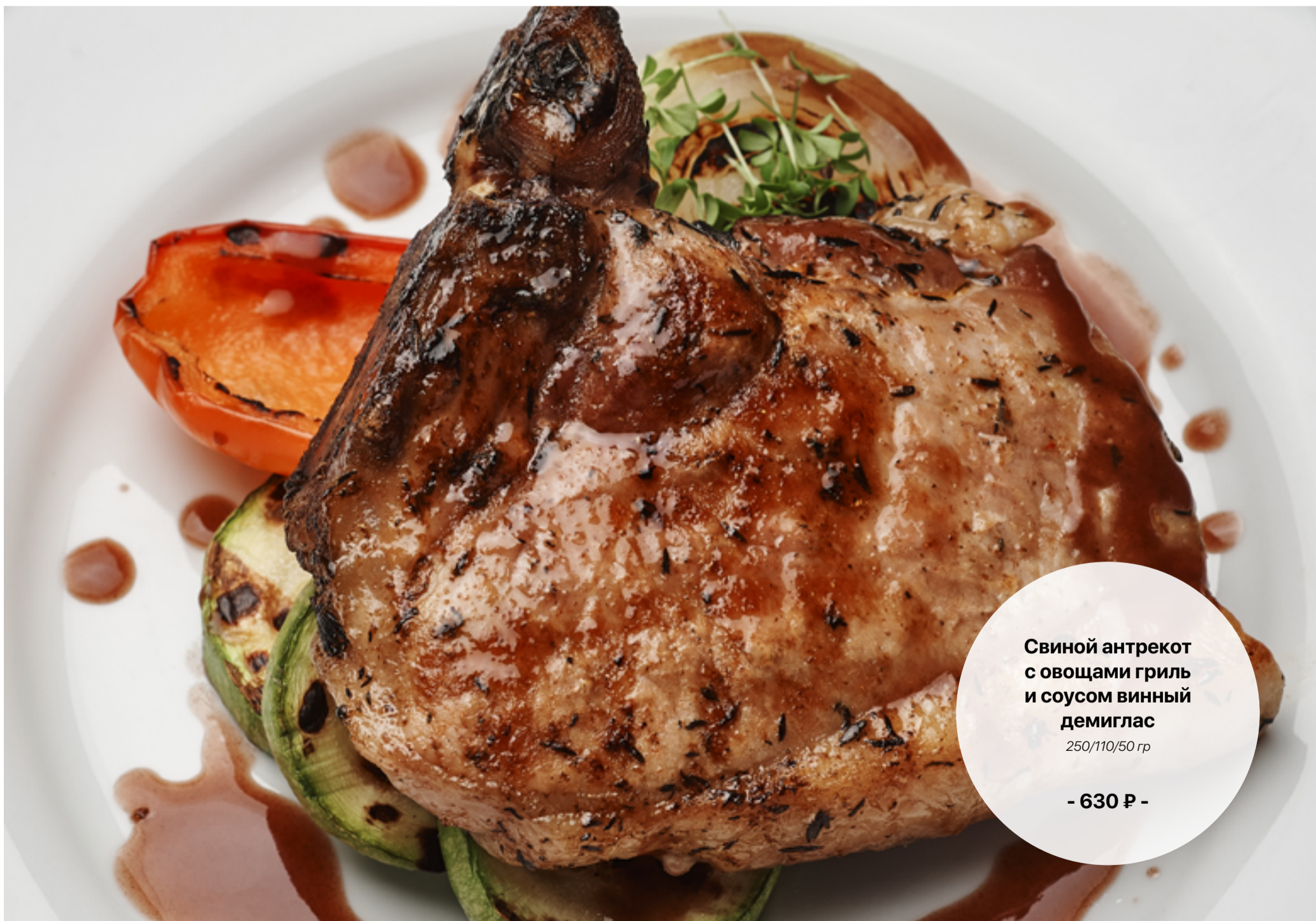
Свиной антрекот с овощами гриль и соусом винный демиглас