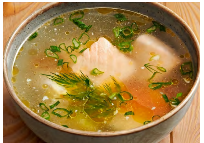
Уха из трёх видов рыб