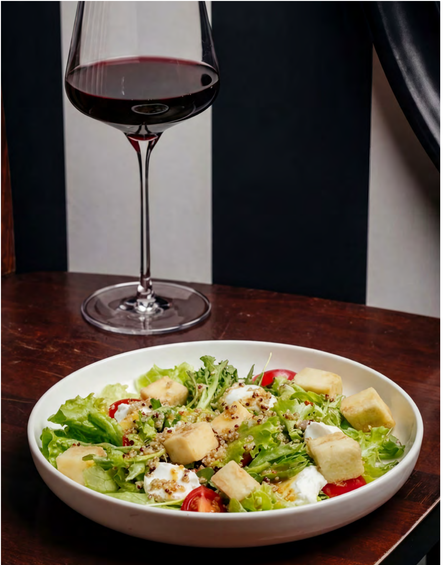
С баклажаном фри и киноа 195 г