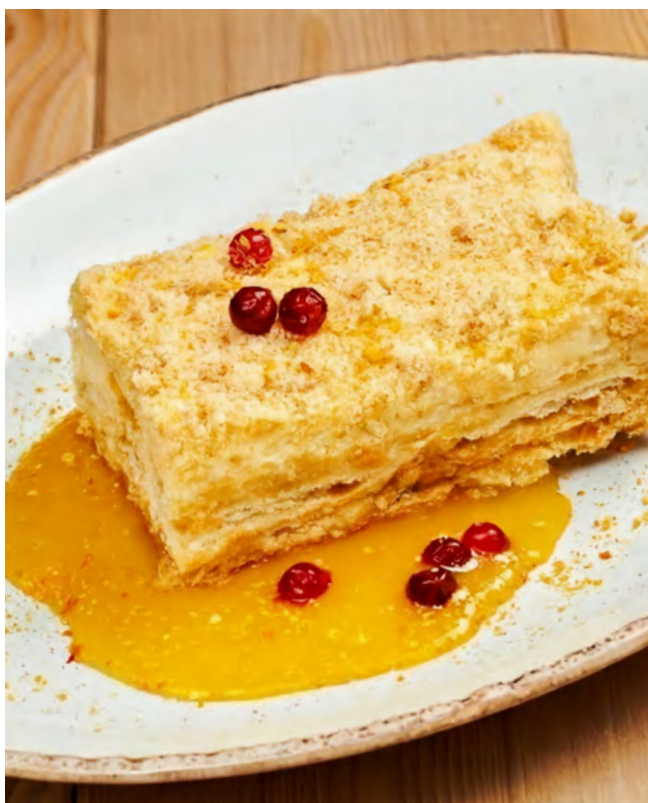
Наполеон со сливочным соусом и брусникой 155 г