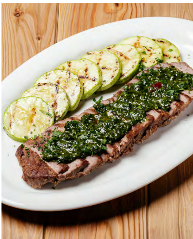
Стейк из толстого края с соусом чимичурри