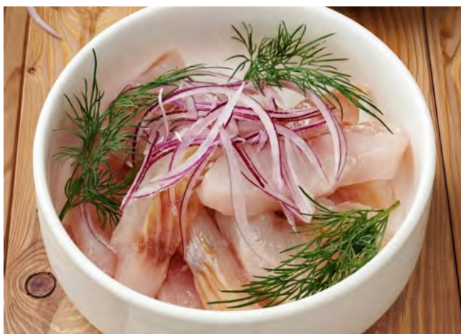
Сугудай из пеляди