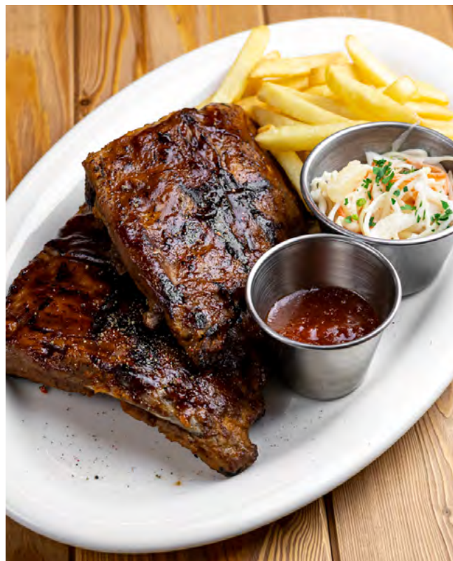
Свинные рёбра барбекю с коул слоу и картофелем фри