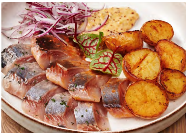
Сельдь домашнего посола с молодым картофелем