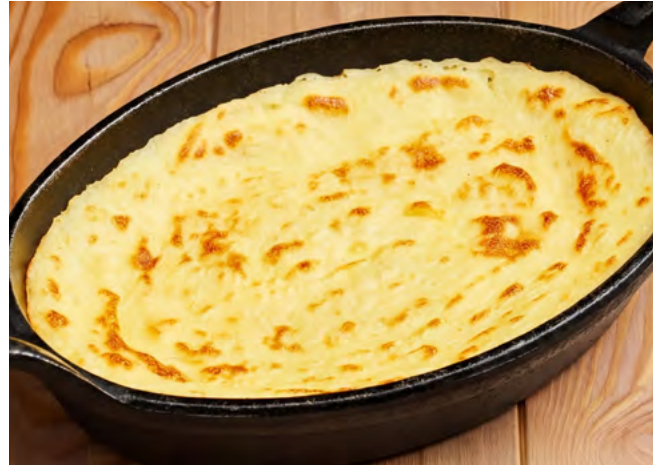
Мясная запеканка с картофелем