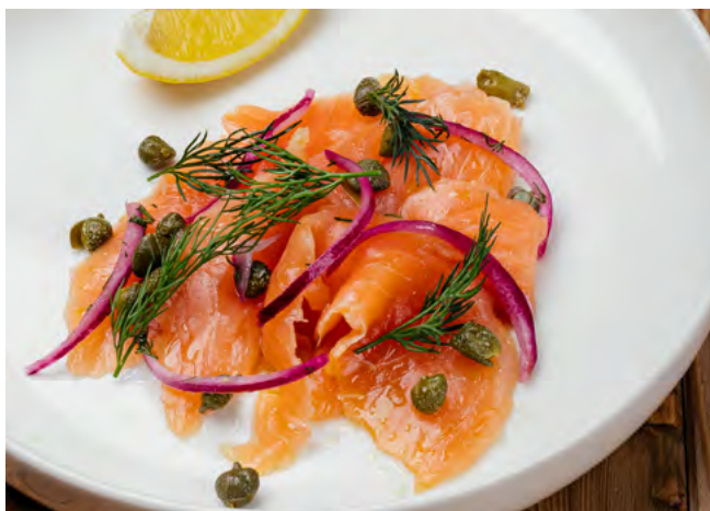
Малосольная сёмга с каперсами