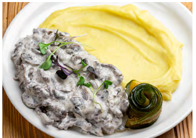
Бефстроганов в сливочном соусе с грибами и картофельным пюре 1200.- 360 г