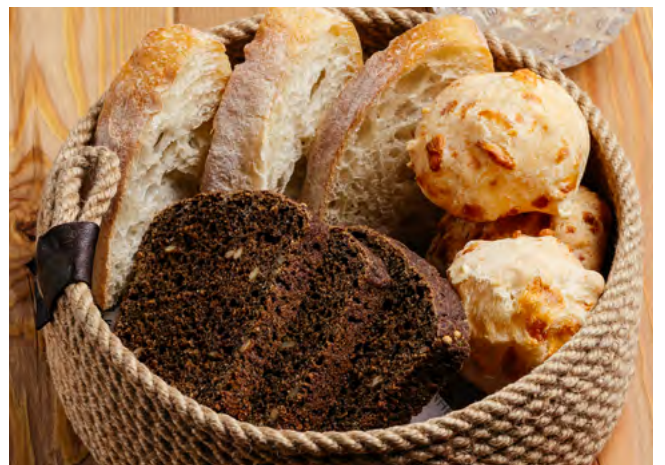
Хлебная корзина 350.- подаётся с томлёным маслом с солью 225 г