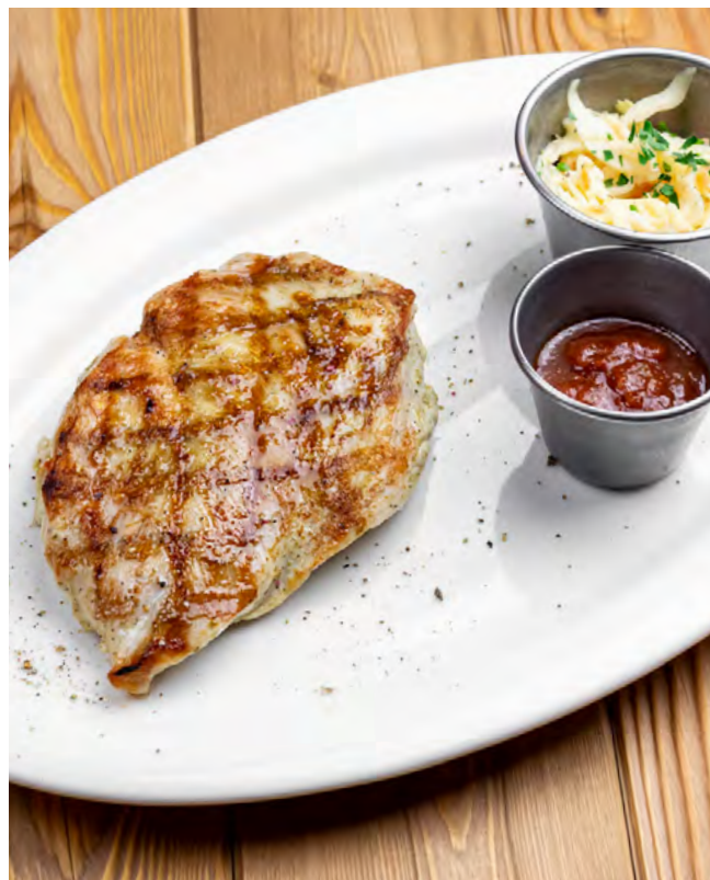
Куриная грудка в специях