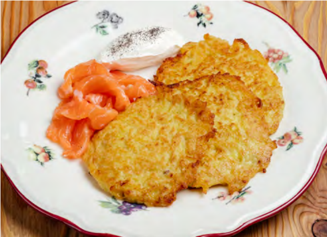
Драники с красной рыбой и сметаной 650.- 160/30/30 г