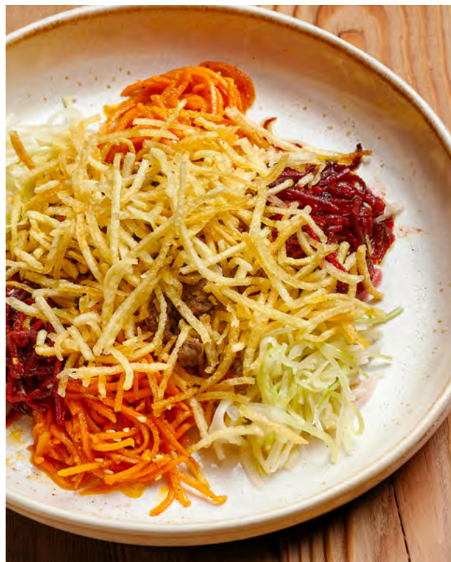
Чафан с говядиной 200 г