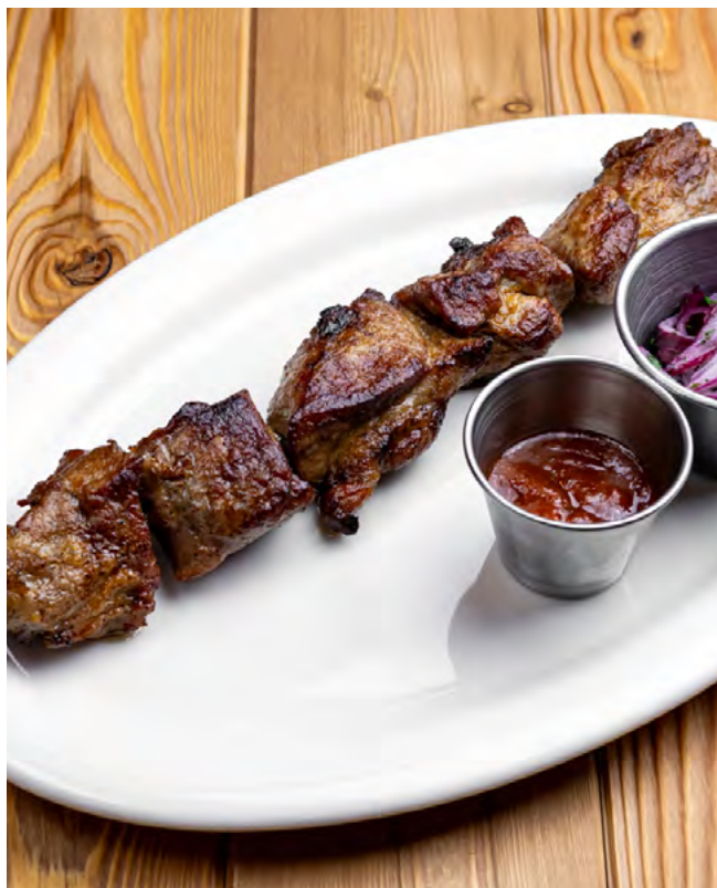
Шашлык из свинины