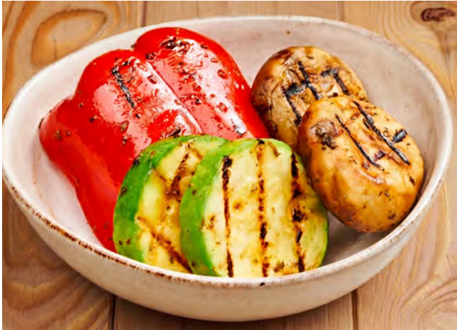
Овощи и грибы гриль 500.- цукини, болгарский перец, шампиньоны 150 г