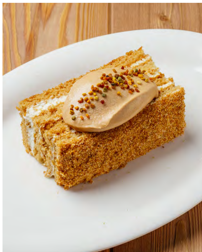
Медовик 150 г