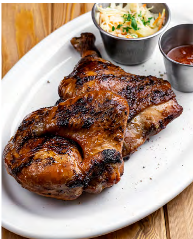
Жареный цыплёнок с чесноком