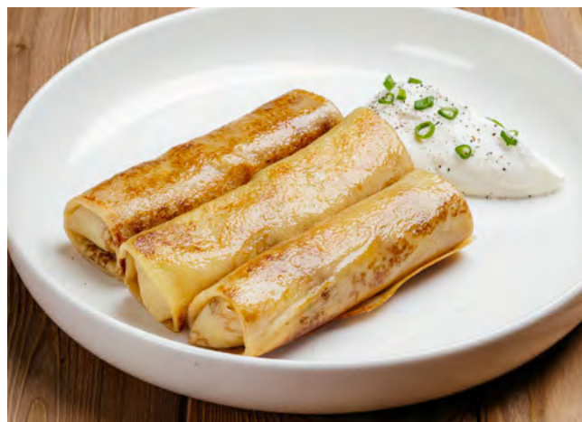
Блины с телятиной и рисом