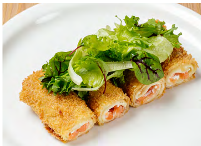
Блины фритте с форелью и крем-чиз