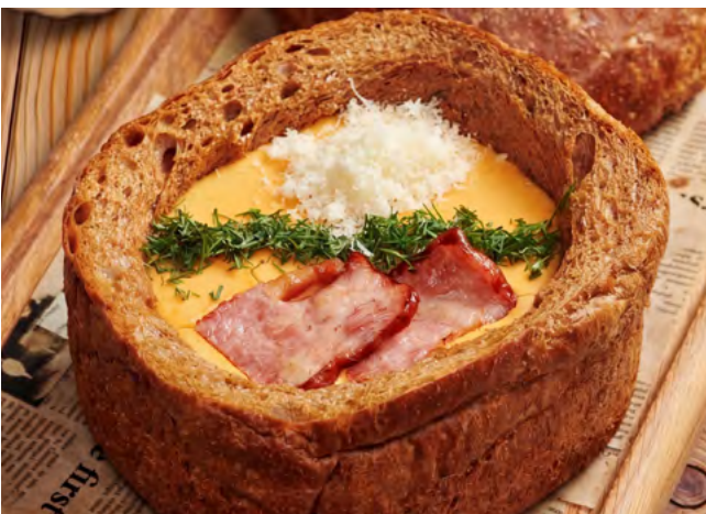
Гороховый суп-пюре с беконом в буханке ржаного хлеба