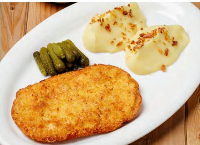
Шницель из цыплёнка с картофельным пюре и сливочным соусом 800.- 280 г