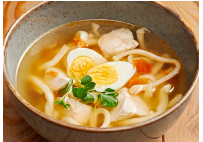
Куриный суп с домашней лапшой