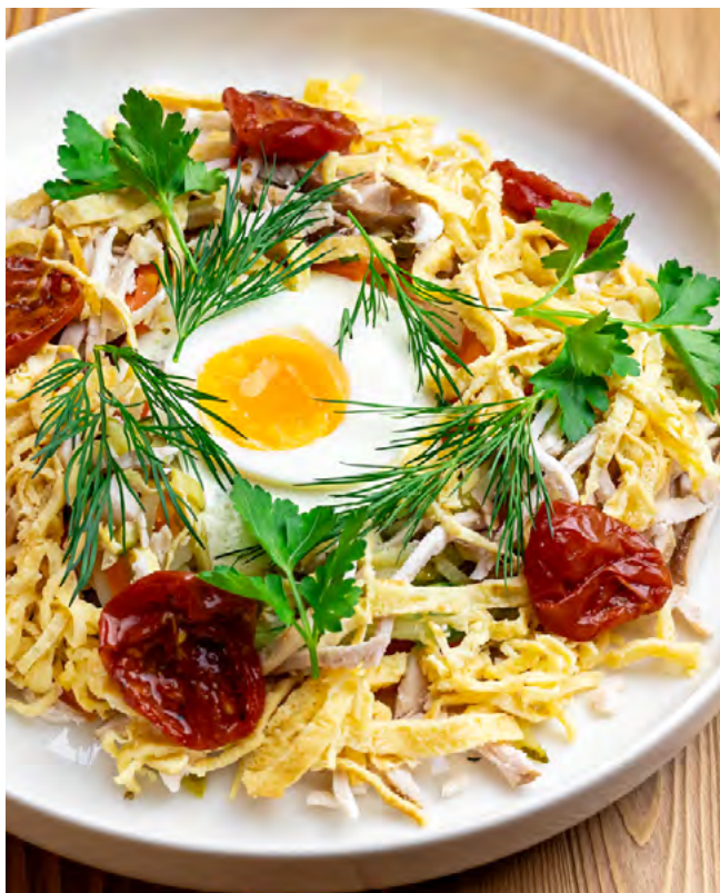
Столичный с копчёным цыплёнком 255 г