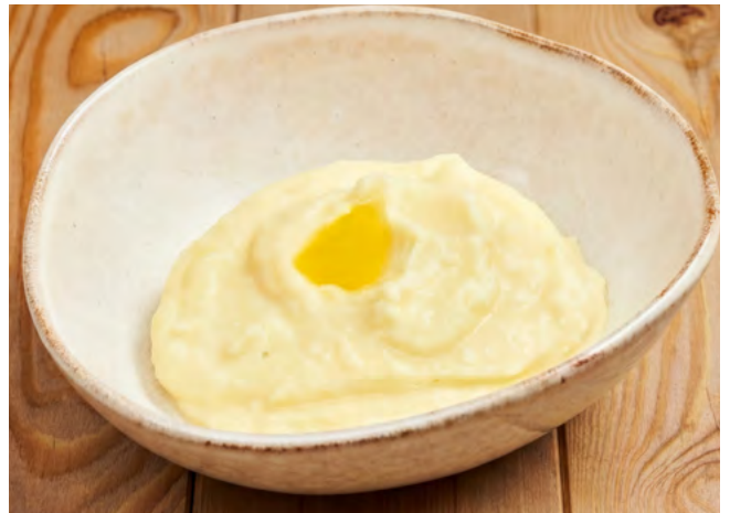
Картофельное пюре 350.- 150 г