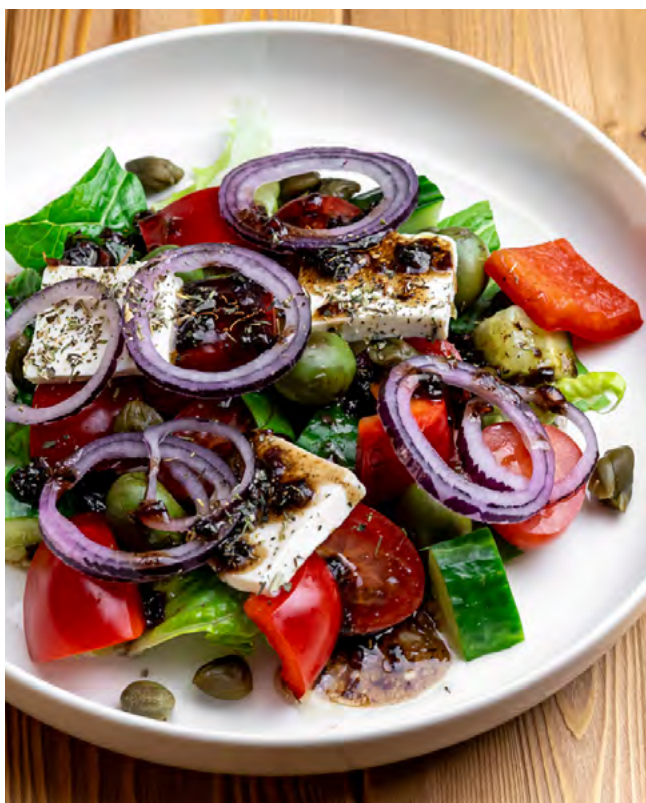
Греческий с каперсами и фетой