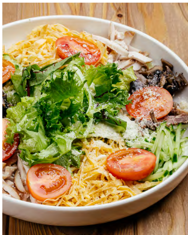
С копчёным языком, курицей и грибами 195 г