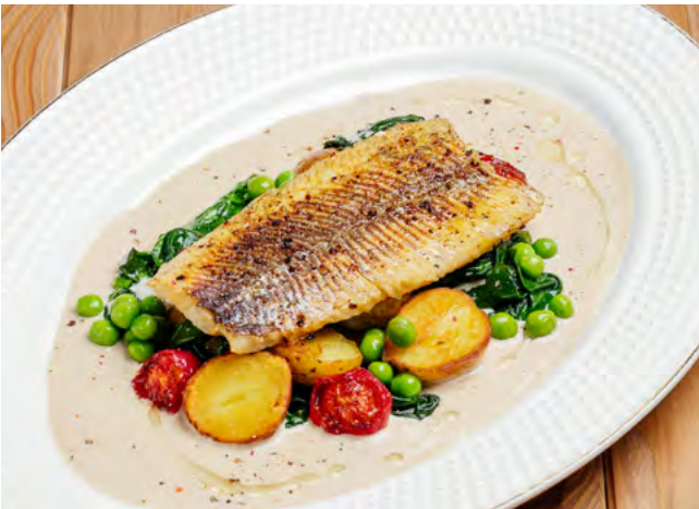
Запечённая пелядь с картофелем, овощами и сливочным соусом