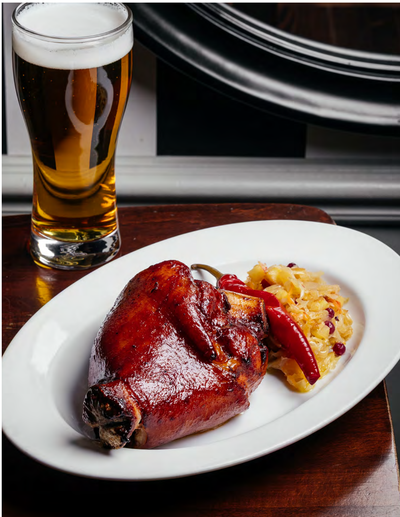
Свиня рулька с тушёной капустой