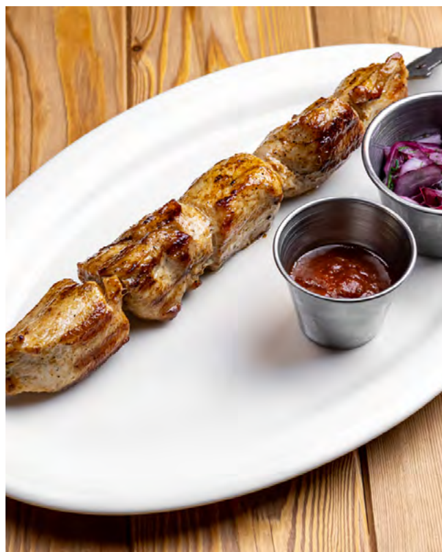
Шашлык из курицы