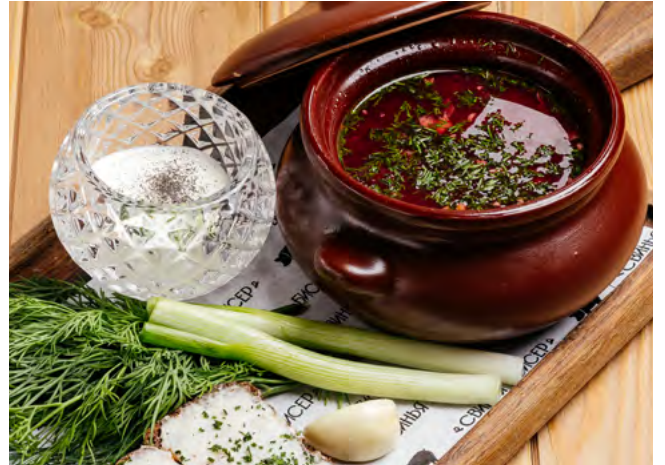
Суточный борщ со свининой и сметаной