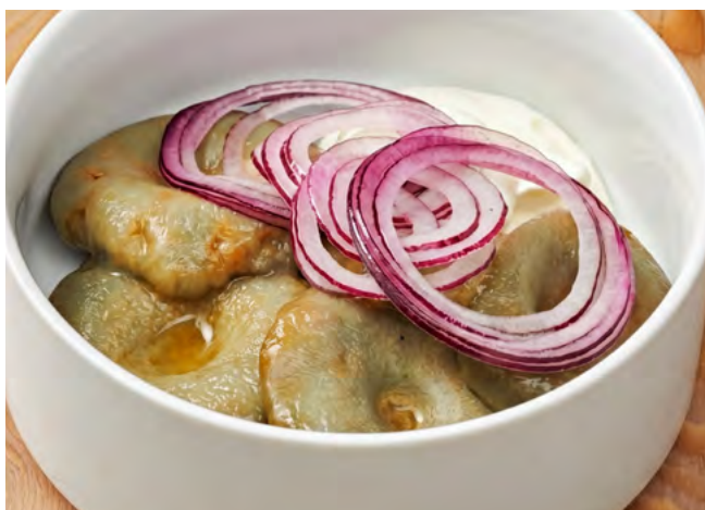
Солёные гузди со сметаной