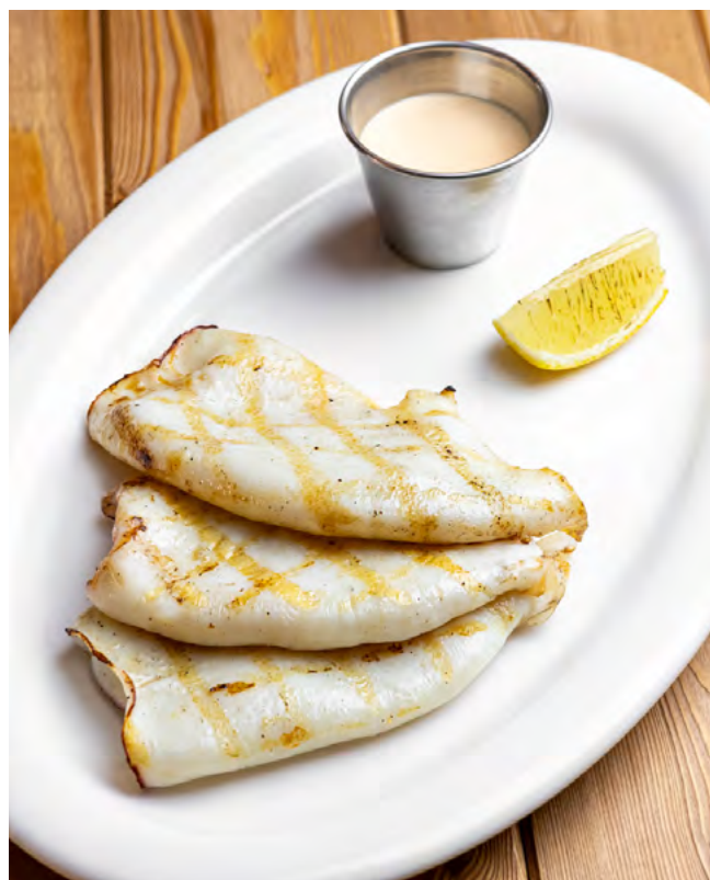
Кальмар гриль с соусом том ям