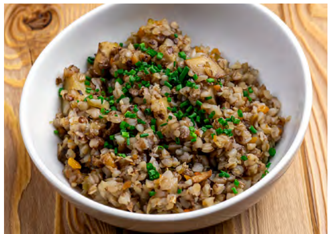
Гречка с белыми грибами 450.- 200 г