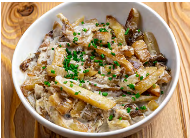
Жареный картофель по-домашнему с белыми грибами 550.- 180 г