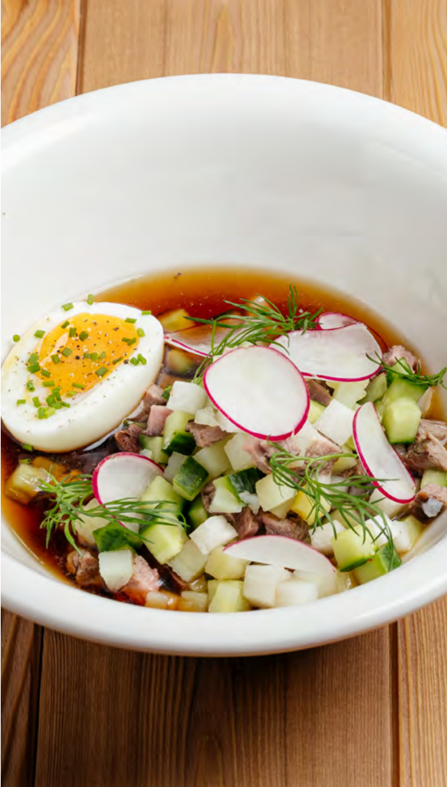
Окрошка с говядиной