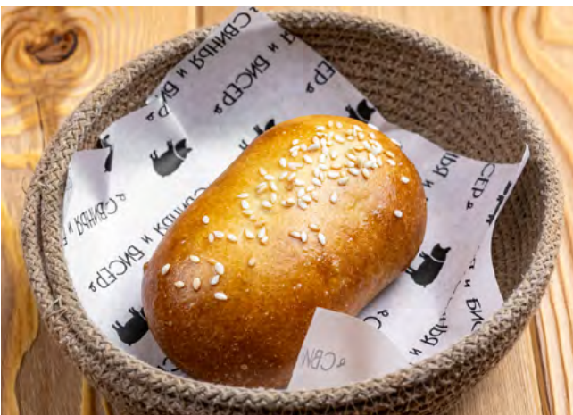
Домашние пирожки с телятиной и рисом 150.- 1 шт.