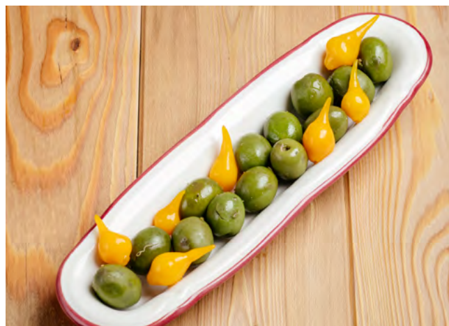
Закуска к вину