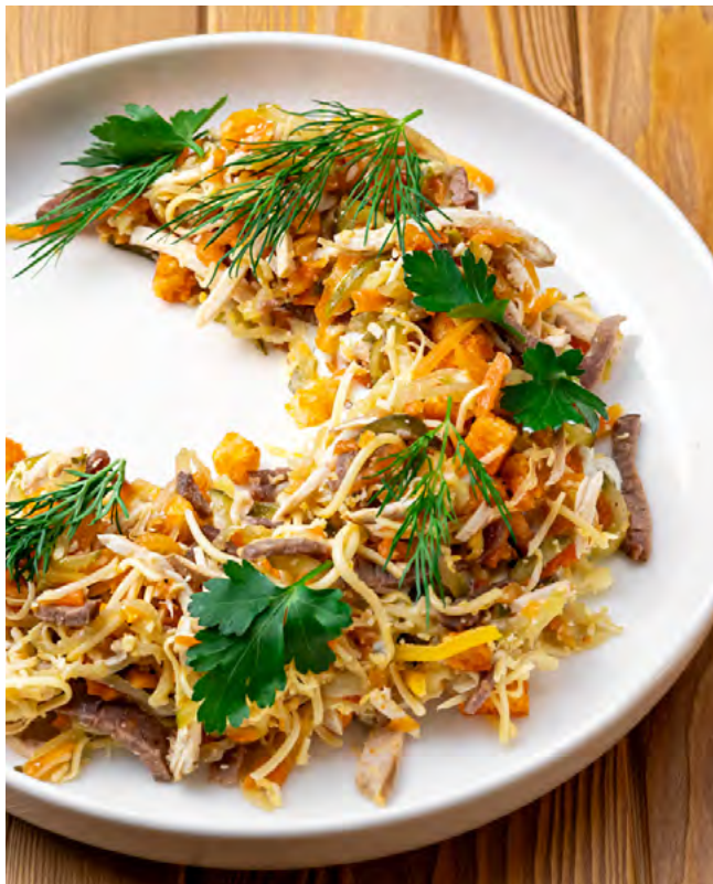
Обжорка с телятиной и копчёным цыплёнком