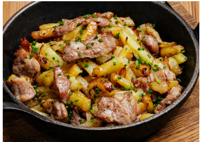
Картофель жаренный по-домашнему со свинойной