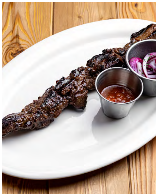
Шашлык из мраморной телятины