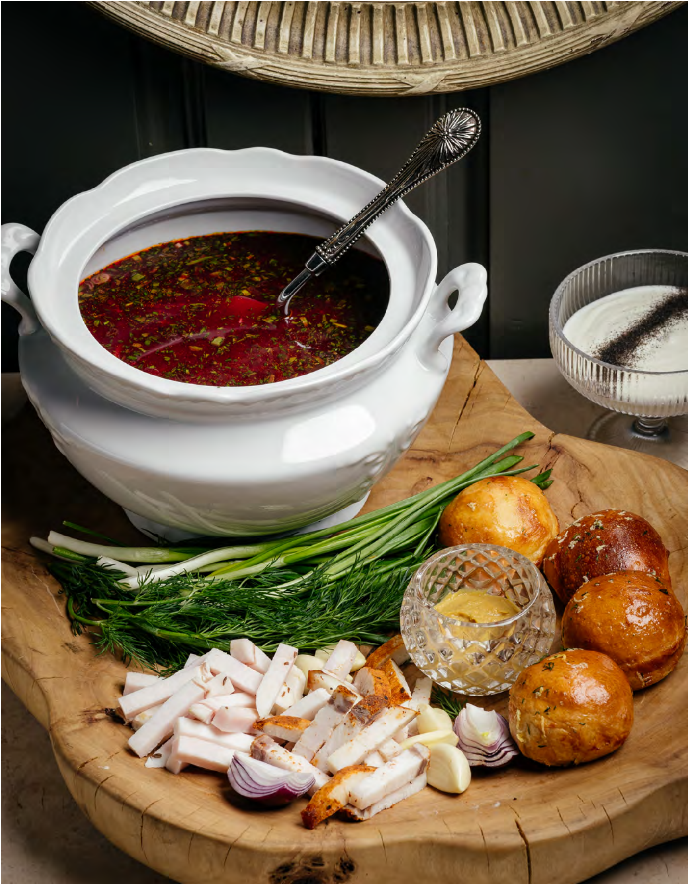
Суточный борщ со свининой и сметаной на компанию 2200 г