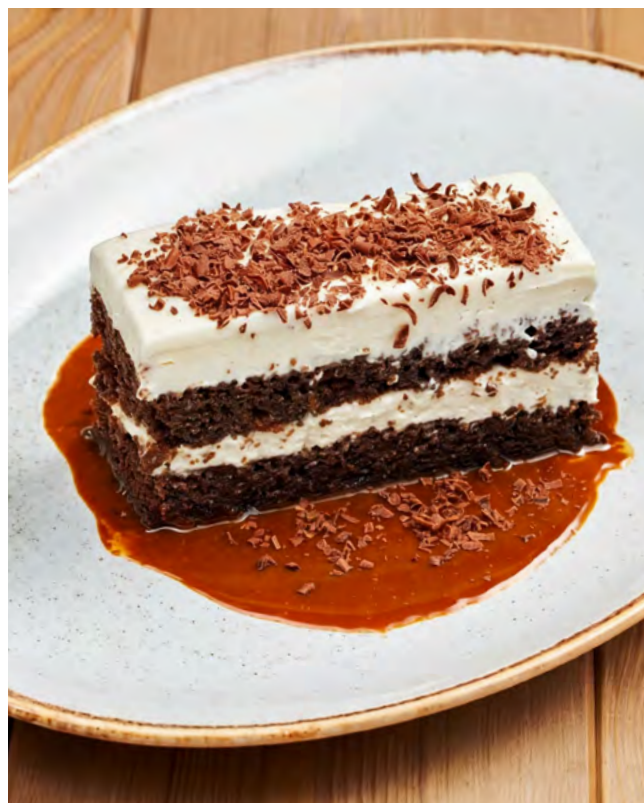
Черёмуховый пирог с шоколадным соусом 160 г