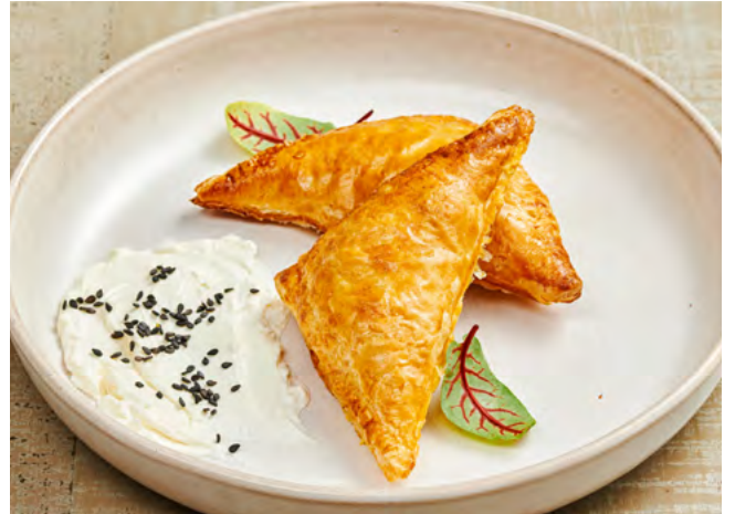
Пирожки с сёмгой и сливочным сыром 770.- 135 г