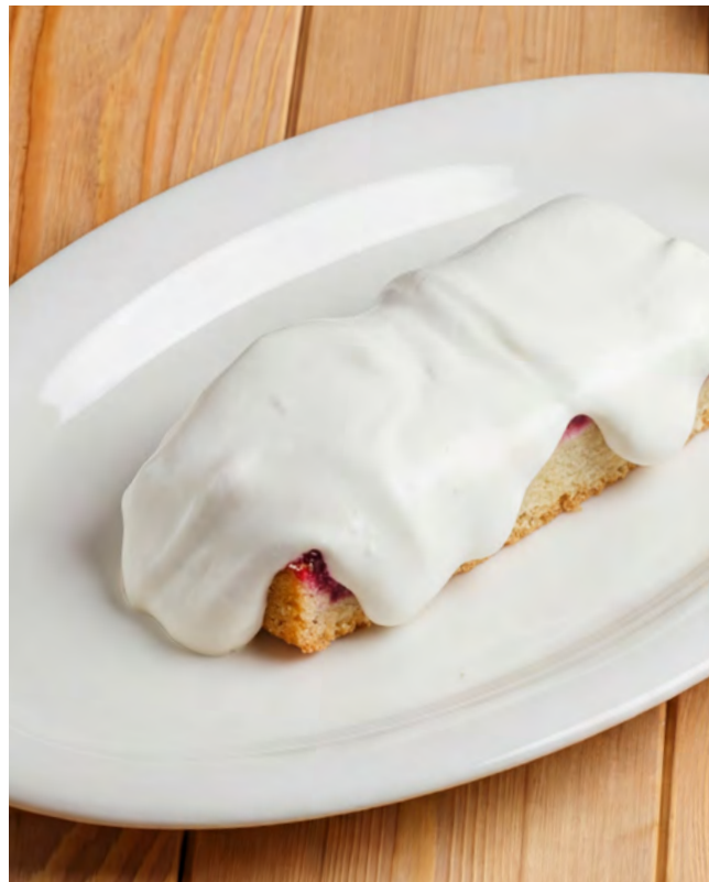
Домашний брусничный пирог со сметаной 150 г