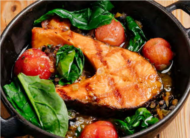
Стейк из форели с перлотто и овощами