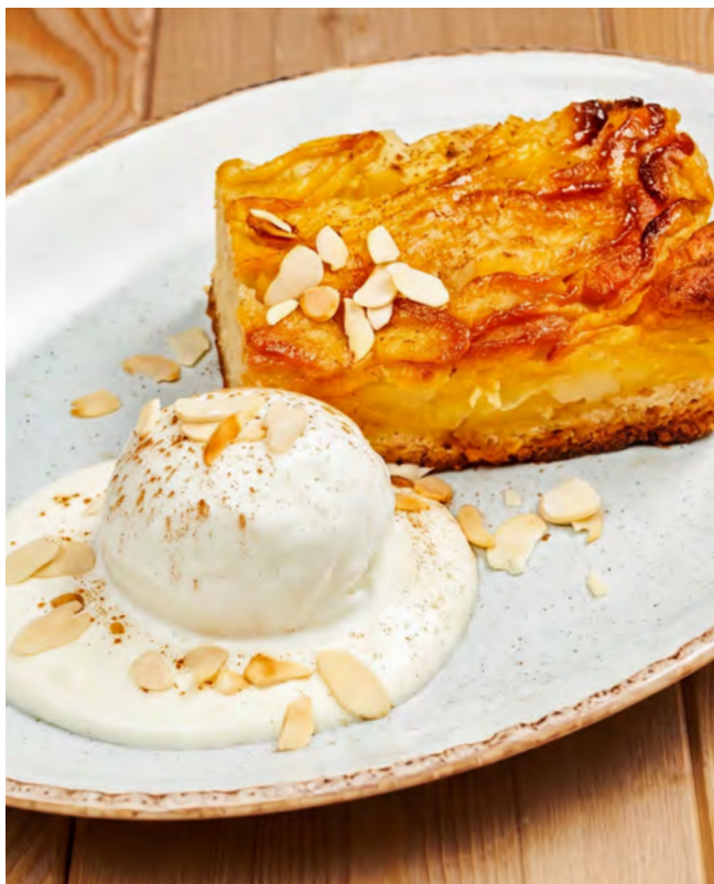
Грушевый пирог с мороженым 180 г