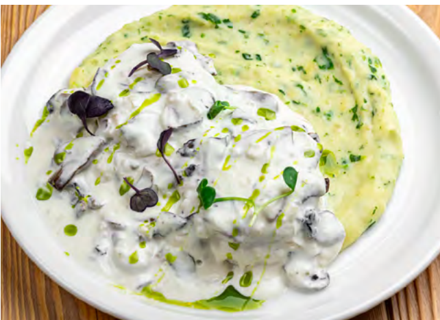
Котлеты из щуки с картофельным пюре, грибами и шпинатом