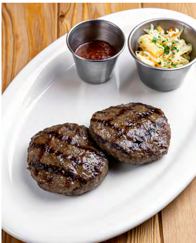
Телячьи котлеты на гриле