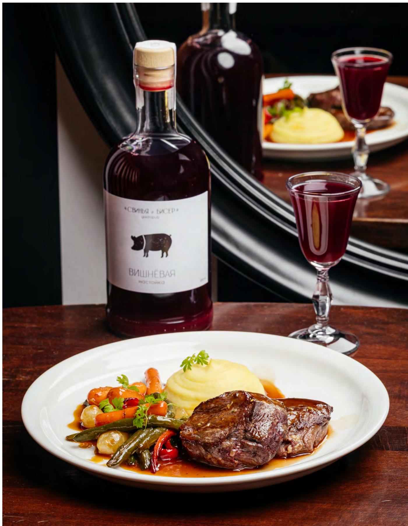
Медальоны из мраморной говядины с овощами и картофельным пюре