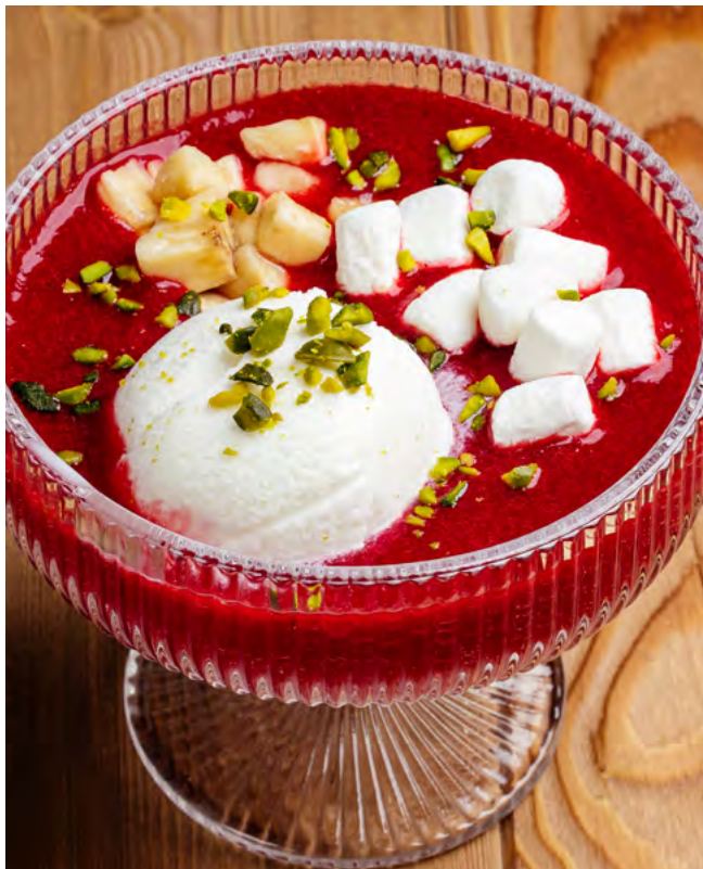
Клубничный суп 255 г