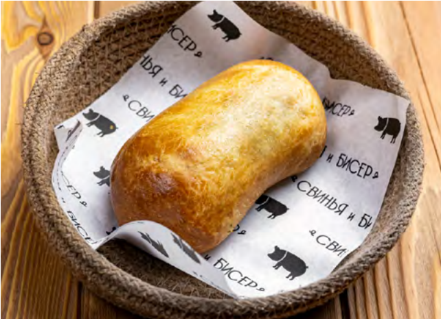
Домашние пирожки с луком и яйцом 110.- 1 шт.