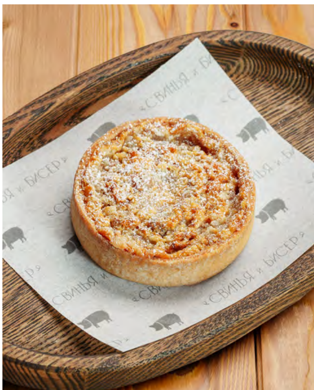
Ореховая корзинка со сгущёнкой и кокосом 70 г