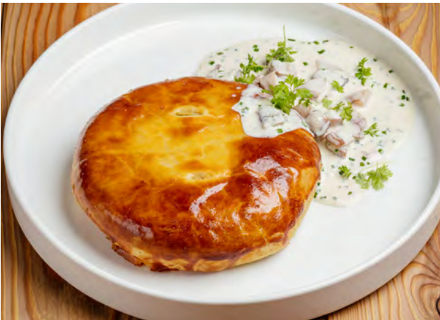
Пирог с томлёной говядиной и капустой 700.- 450 г