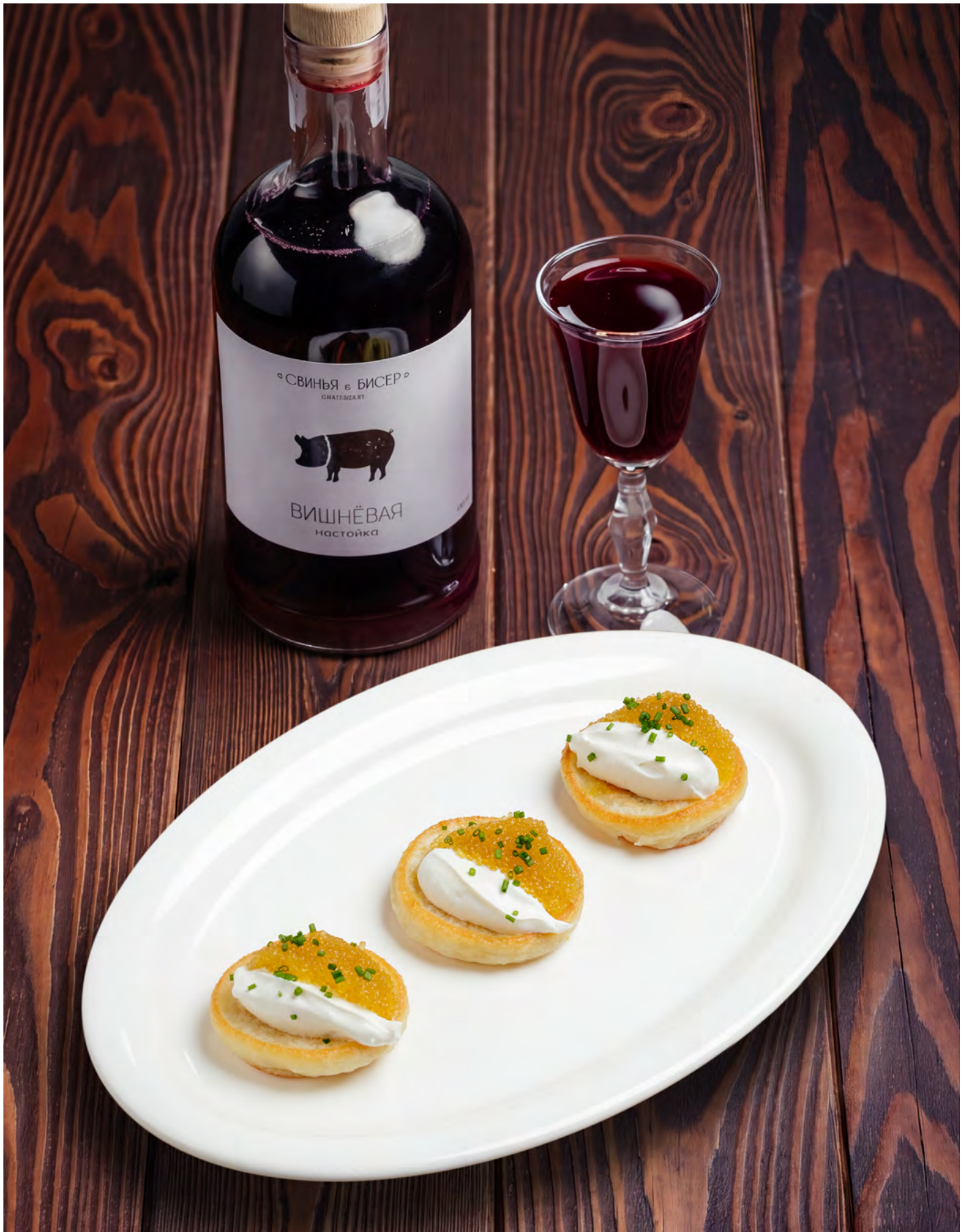
Оладьи со сметаной и икрой щуки 160 г