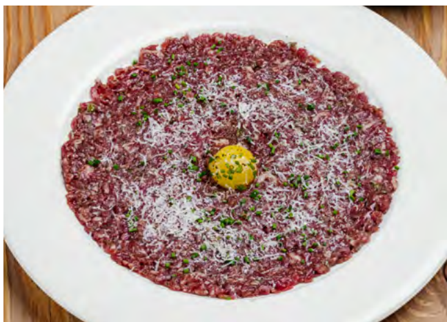
Тартар из говядины с пикантной гренкой