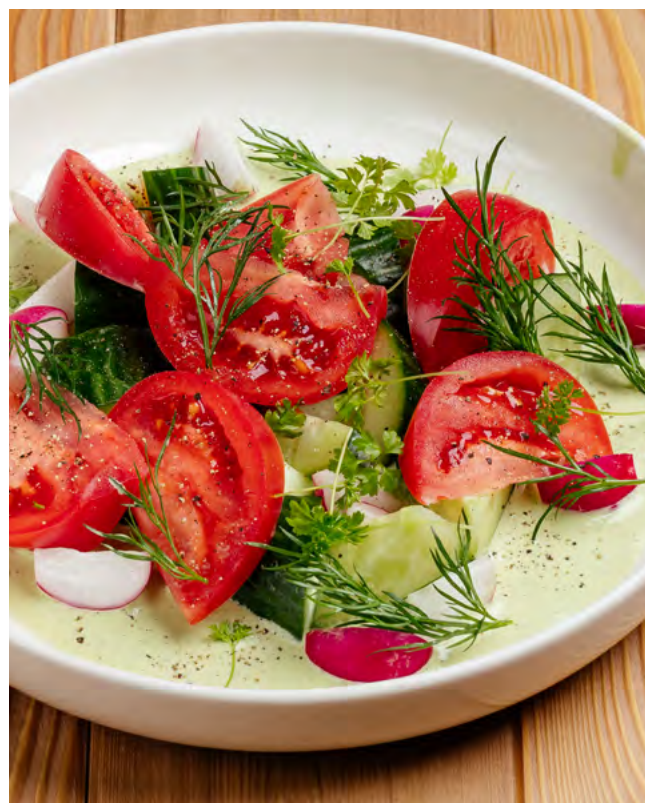
Со свежими овощами и сметаной