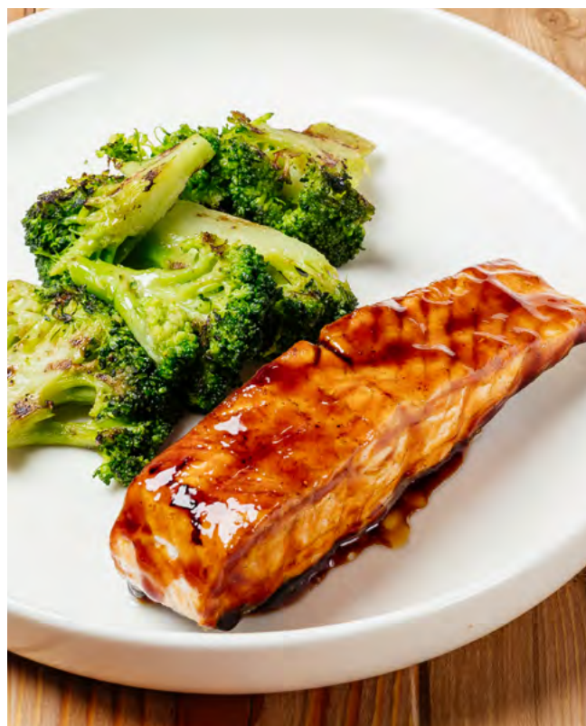
Стейк из сёмги с соусом унаги и брокколи на гриле