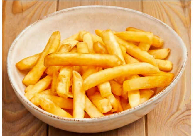
Картофель фри 440.- 150 г