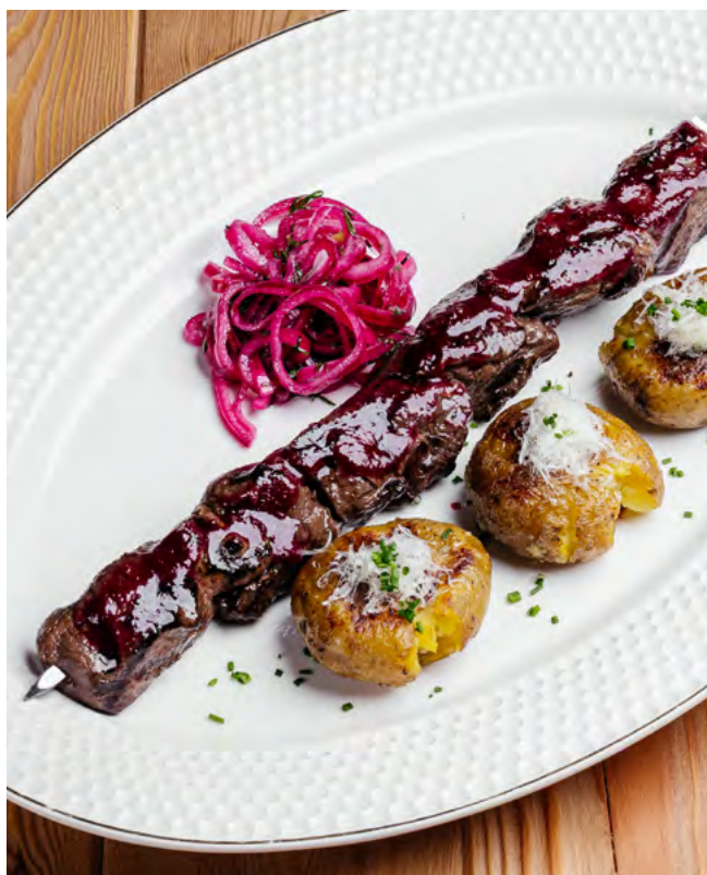
Шашлык из вырезки оленя с мятым молодым картофелем и пармезаном