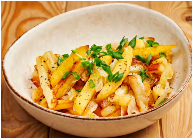
Жареный картофель по-домашнему 470.- 150 г