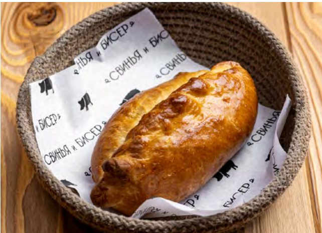
Домашние пирожки с капустой 110.- 1 шт.