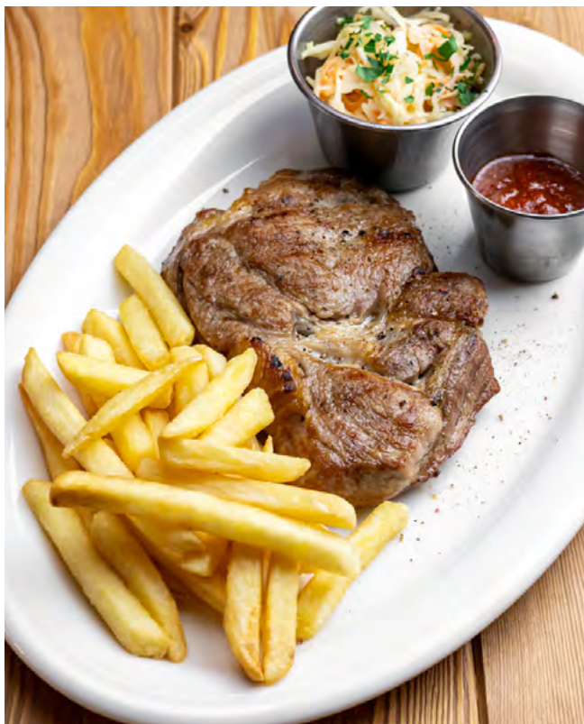
Свиная шея в специях с картофелем фри