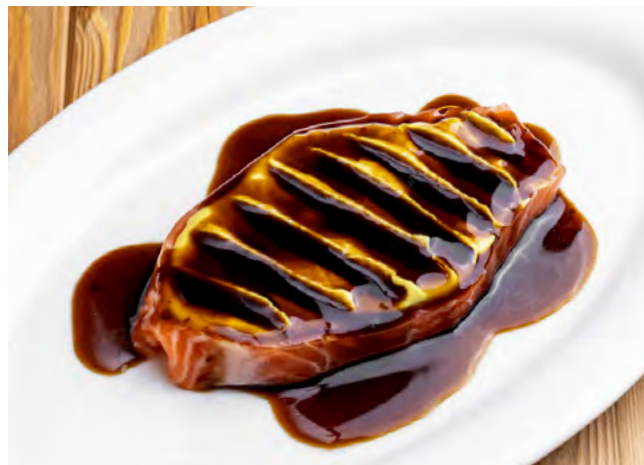
Сёмга с соевым соусом под дижонской горчицей