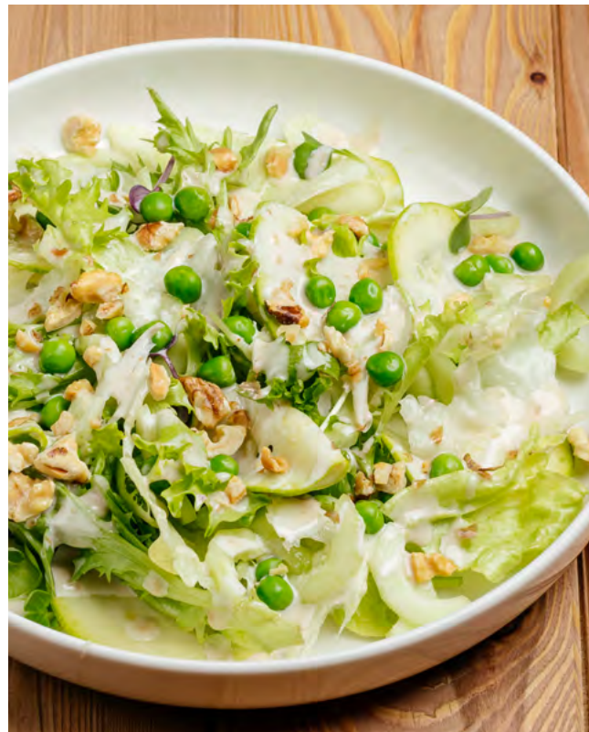
Зелёный с огурцом, сельдереем и ореховым соусом