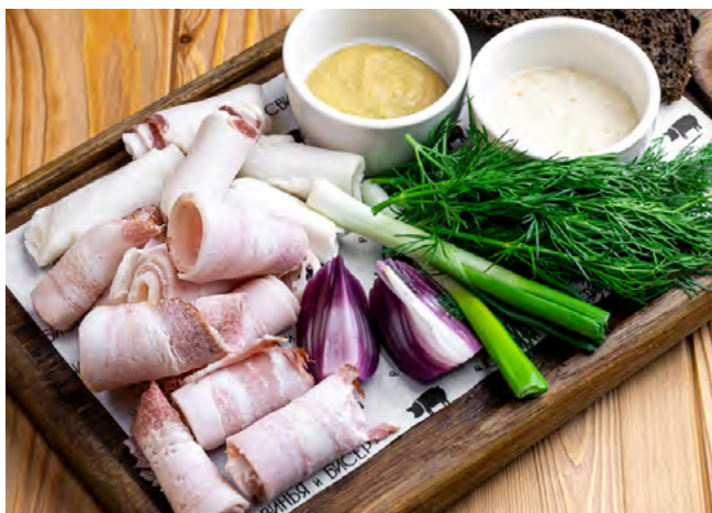
Сало домашнего посола