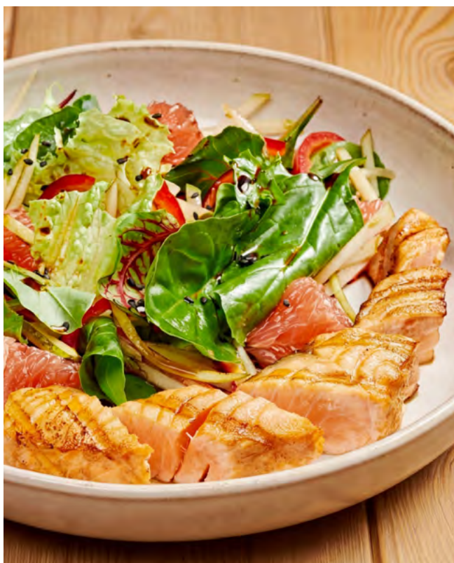
Со слегка обжаренной сёмгой и грейпфрутом 205 г