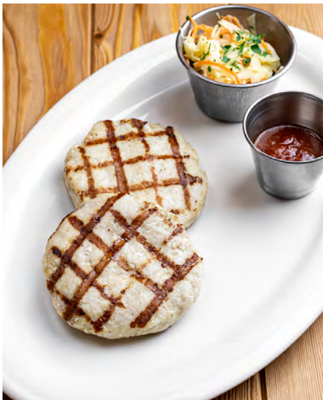
Куриные котлеты на гриле