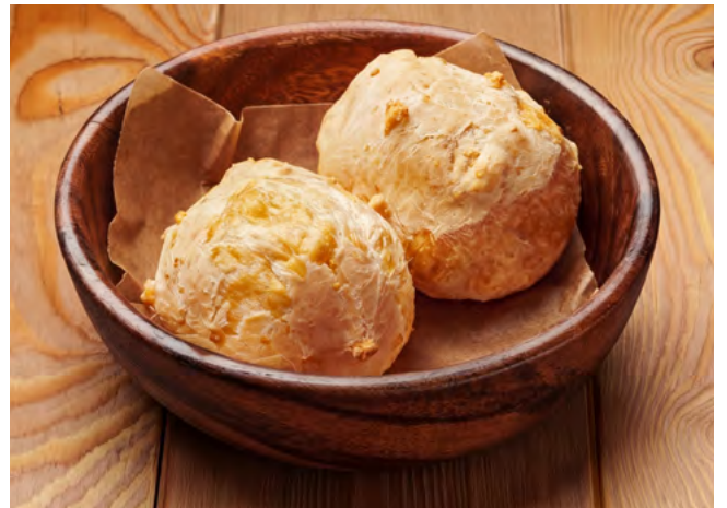
Сырные булочки 60.- 1 шт.