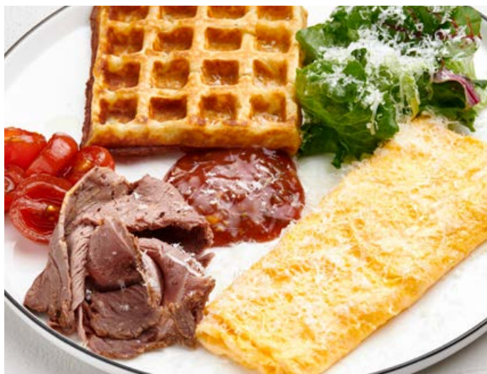
Вафля с омлетом и пастромой из говядины