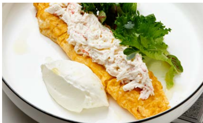
Омлет со снежным крабом