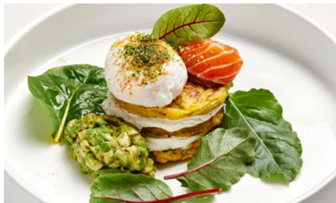
Оладьи из цуккини с малосоленным лососем и яйцом пашот