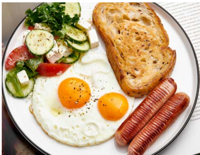
Яичница с сосисками и овощи с фетой