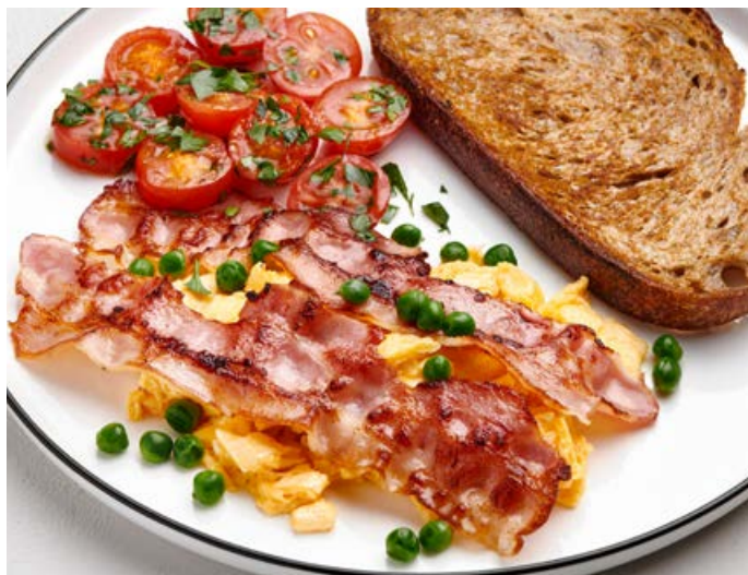
Скрэмбл с беконом и томаты черри