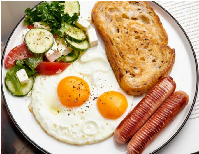
Яичница с сосисками и овощи с фетой