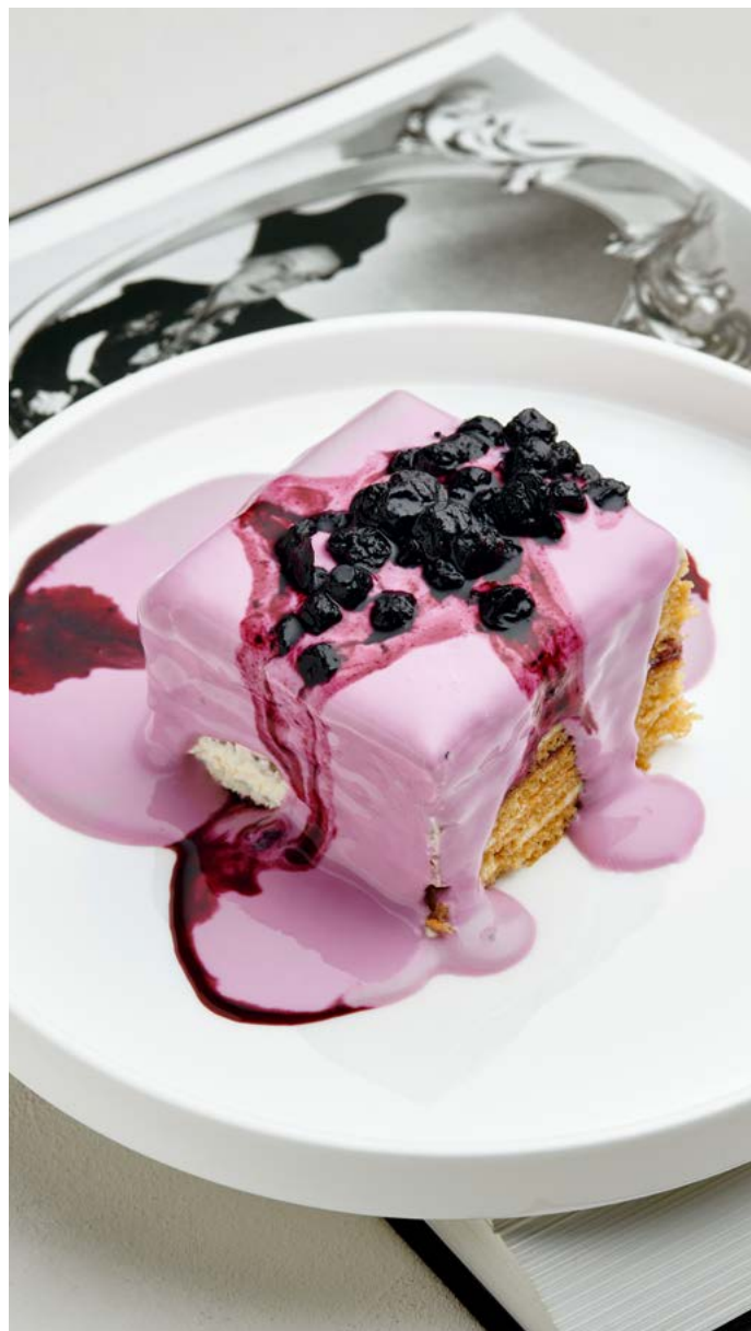
Сметанник с черникой