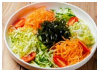
Дальневосточный салат с морской капустой 200 г