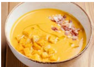
Гороховый крем-суп с копчёным беконом 320 г