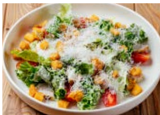
Цезарь с цыплёнком 160 г