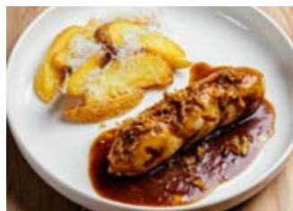
Куриная колбаска с мясным соусом и картофельными дольками 90/80/30 г