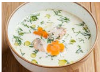
Сливочная уха 320 г