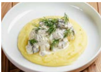
Тефтели из щуки с картофельным пюре 100/120/55 г