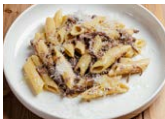
Пенне в сливочно- трюфельном соусе с рваной говядиной 190 г