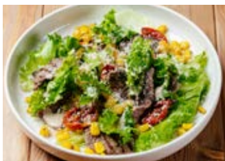
Салат с говядиной, черри и кукурузой 150 г

В каждый сет включены две сырные булочки и напиток. Блюда должны быть из разных категорий.