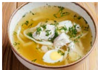
Куриный суп с лапшой 300 г