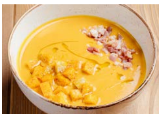
Гороховый крем-суп с копчёным беконом 260 г