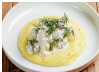
Тефтели из щуки с картофельным пюре 100/120/55 г