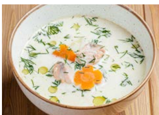
Сливочная уха 320 г