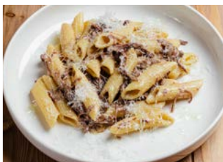
Пенне в сливочно- трюфельном соусе с рваной говядиной 190 г