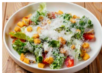
Цезарь с цыплёнком 160 г