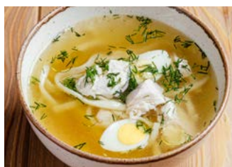
Куриный суп с лапшой 300 г