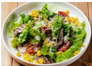
Салат с говядиной, черри и кукурузой 150 г