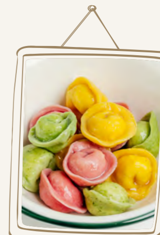
Цветные пельмени со сметаной 160 г 350.-