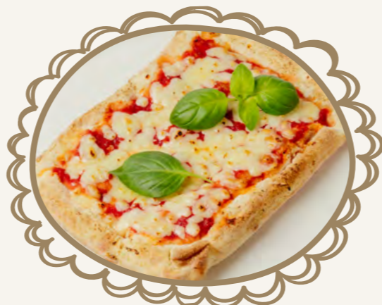
Пицца Маргарита 170 г 350.-