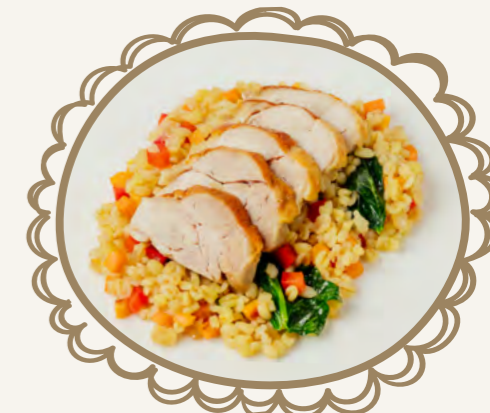
Булгур с курицей 200 г 450.-