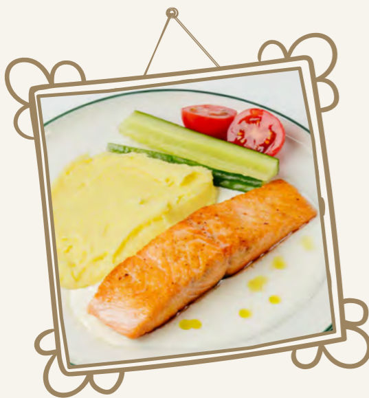
Лосось с картофельным пюре и сливочным соусом 270 г 650.-