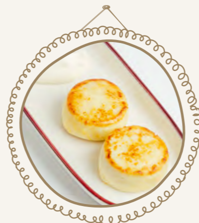
Сырники со сладкой сметаной 130 г 300.-