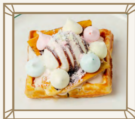
Вафля с бананом и мороженым 185 г 300.-