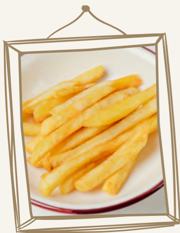
Картофель фри 80 г 260.-