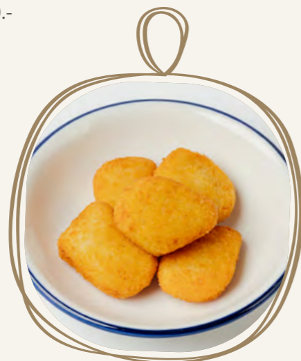
Наггетсы 100 г 300.-