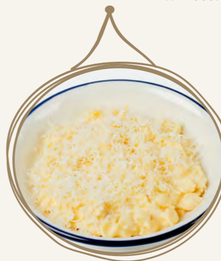
Макароны с сыром 200 г 350.-