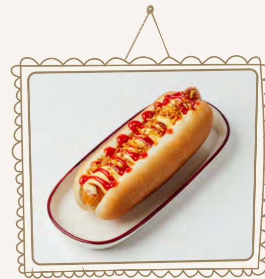
Хот-дог с сосиской и сырным соусом 210 г 380.-