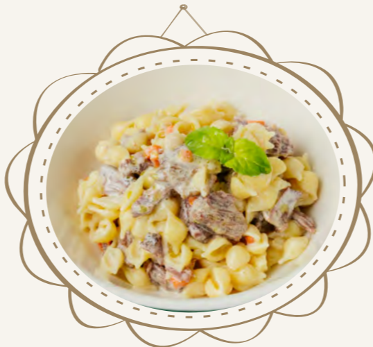
Макароны с телячьими щечками 220 г 450.-