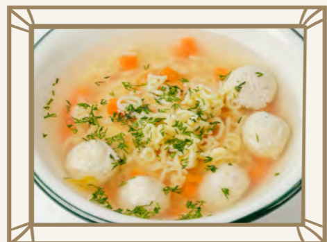
Суп с куриными фрикадельками и макаронами 250 г 290.-