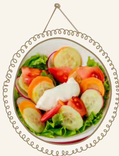
Овощной салат 120 г 300.-