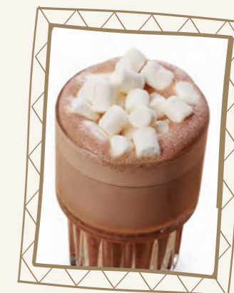
Какао с маршмэллоу 230 мл 250.-

Просьба предупреждать Вашего официанта об имеющейся у Вас аллергии на определенные продукты.