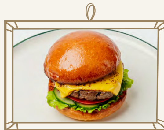
Бургер с мясной котлетой 200 г 500.-