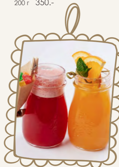
Карамельный лимонад / Персиковый лимонад 250 мл 160.-