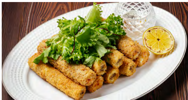
Ассорти блинов с телятиной и рисом / с форелью 1500.- 810 г