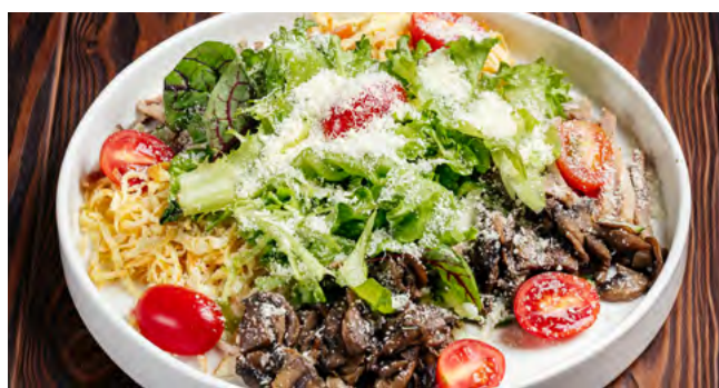
Салат с копчёным языком, курицей и грибами 1300.- 500 г