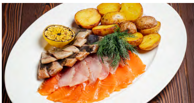
Рыбная тарелка 1500.- 500 г