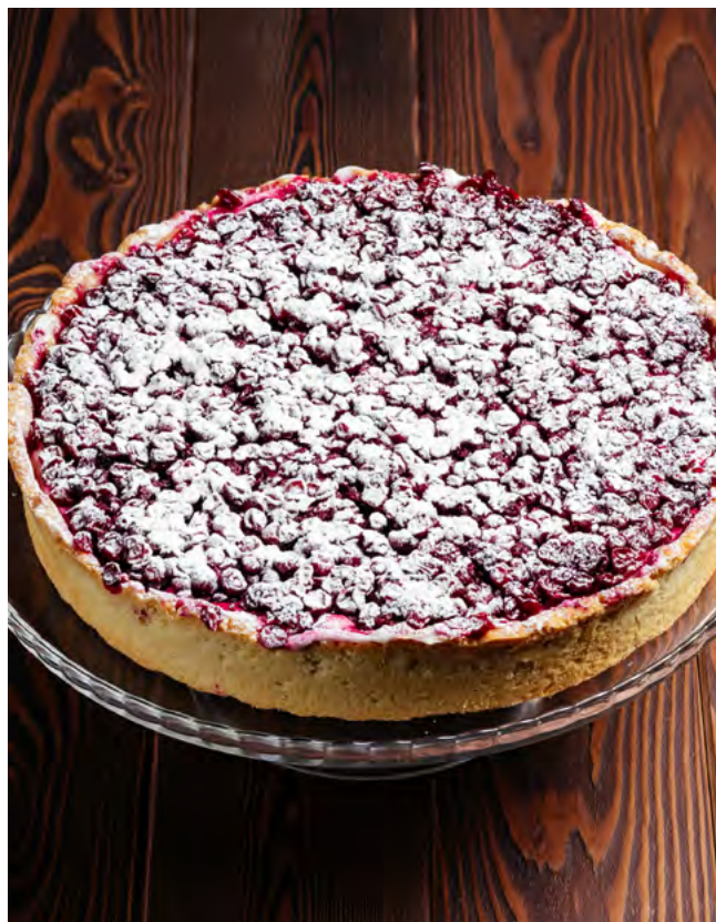
Брусничный пирог со сливочным кремом