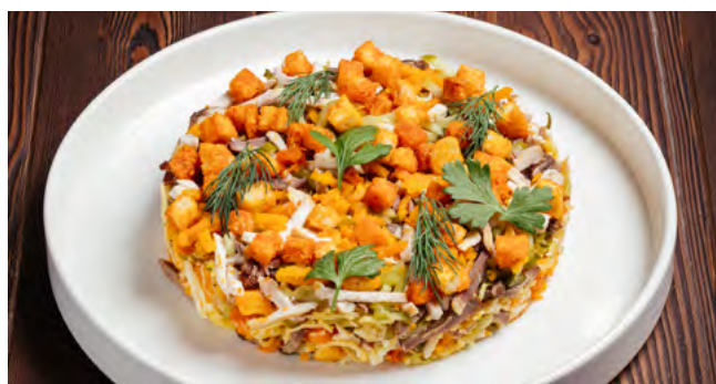
Обжорка с телятиной и копчёным цыплёнком 1200.- 500 г