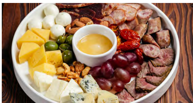
Сыр и мясные деликатесы 2000.- 460 г