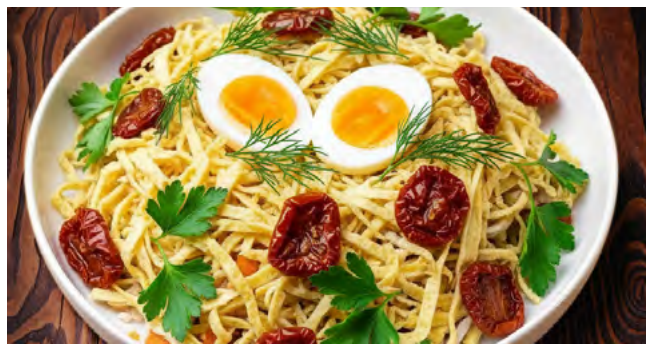
Столичный с копчёным цыплёнком 1100.- 500 г