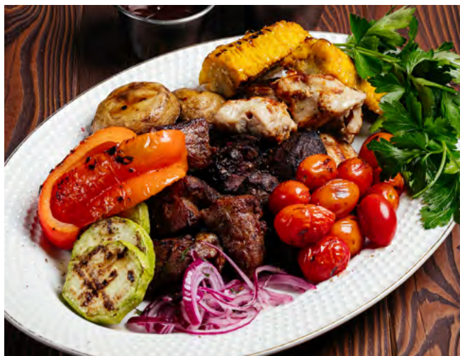
Мясное ассорти на гриле