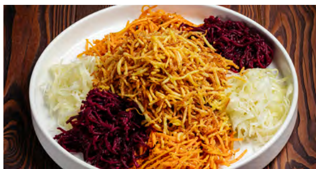
Чафан с говядиной 1100.- 500 г