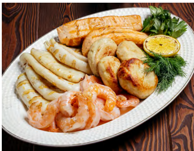
Рыбное ассорти на гриле