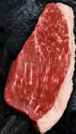
ТОП СИРЛОЙН КАП